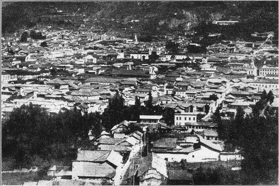
Quito. Blick über die Stadt. Im Hintergrund die Abhänge des Vulkans Pichincha.

stark gesunken. Eiskalte Winde zerrten uns fast von den Wänden, und die blaugefrorenen Finger waren nicht mehr imstande, das Seil zu halten. Vorsichtigerweise ging ich diesmal als letzter. Meine beiden Begleiter torfelten vor mir im Halbdunkel abwärts wie Betrunkene. Nur ein ganz grober Ruck am Seil, in Verbindung mit einem brüllenden Zuruf, vermochte die beiden an besonders kritischen Stellen vor dem Absturz zu bewahren.