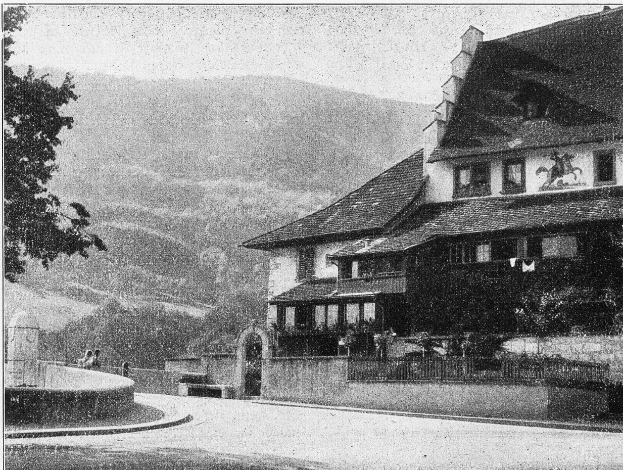
Zur Alten Post in Aarburg.

Sie durchschritten eine breite, schon herbst-