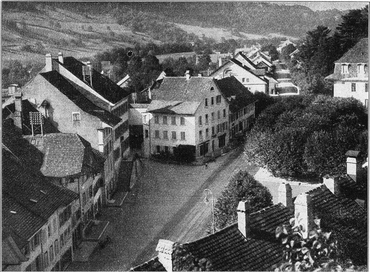
Hauptplatz in Aarburg.

„Für einen Mann, der mir gefallen müßte, vielleicht doch! — Aber sieh mal, bei mir ist das alles so ganz anders als bei dir. Ich gehe nie-