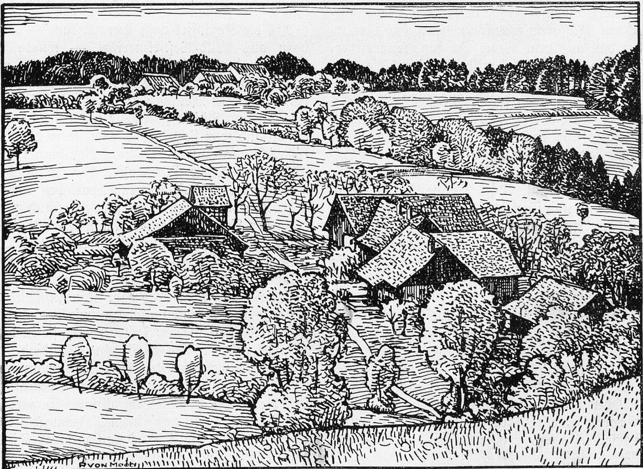
P. v. Moos: Stürzikon bei Ober-Embrach von Nordwesten gesehen.

Alles, was sein tägliches Leben dem Menschen an Problemen aufgibt, ist längst von seinen Vorfahren gelöst worden. Was er ererbt von seinen Vätern hat, erwirbt er, um es zu besitzen — und nennt es seinen Instinkt. Was er nicht ererbt hat, macht sich als Lücke im Instinkt fühlbar: Die traurige Erfahrung, daß man vom nettesten Menschen Klöße mit Strichnien nicht annehmen sollte, konnte dem Hunde nicht