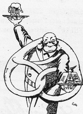
SINGER's SALZBREZELI DAS BESTE ZU BIER UND WEIN