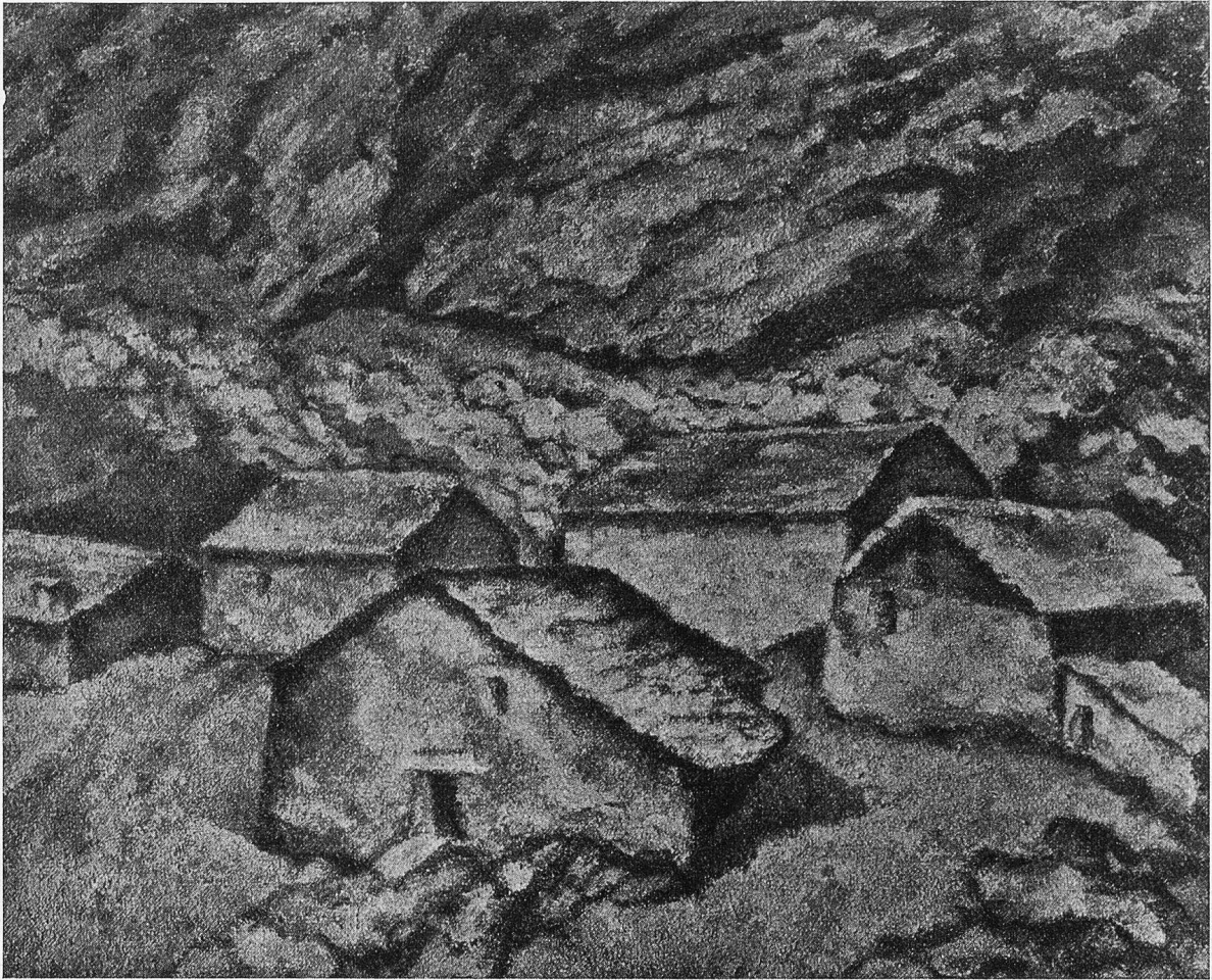
Steinhütten vor der Felswand.