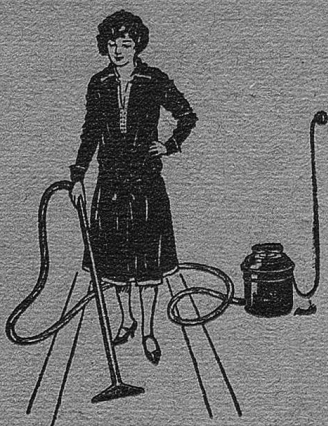
Fr. 210.— komplett.

Effektive Staubbeseitigung mit dem modernen Kesselapparat