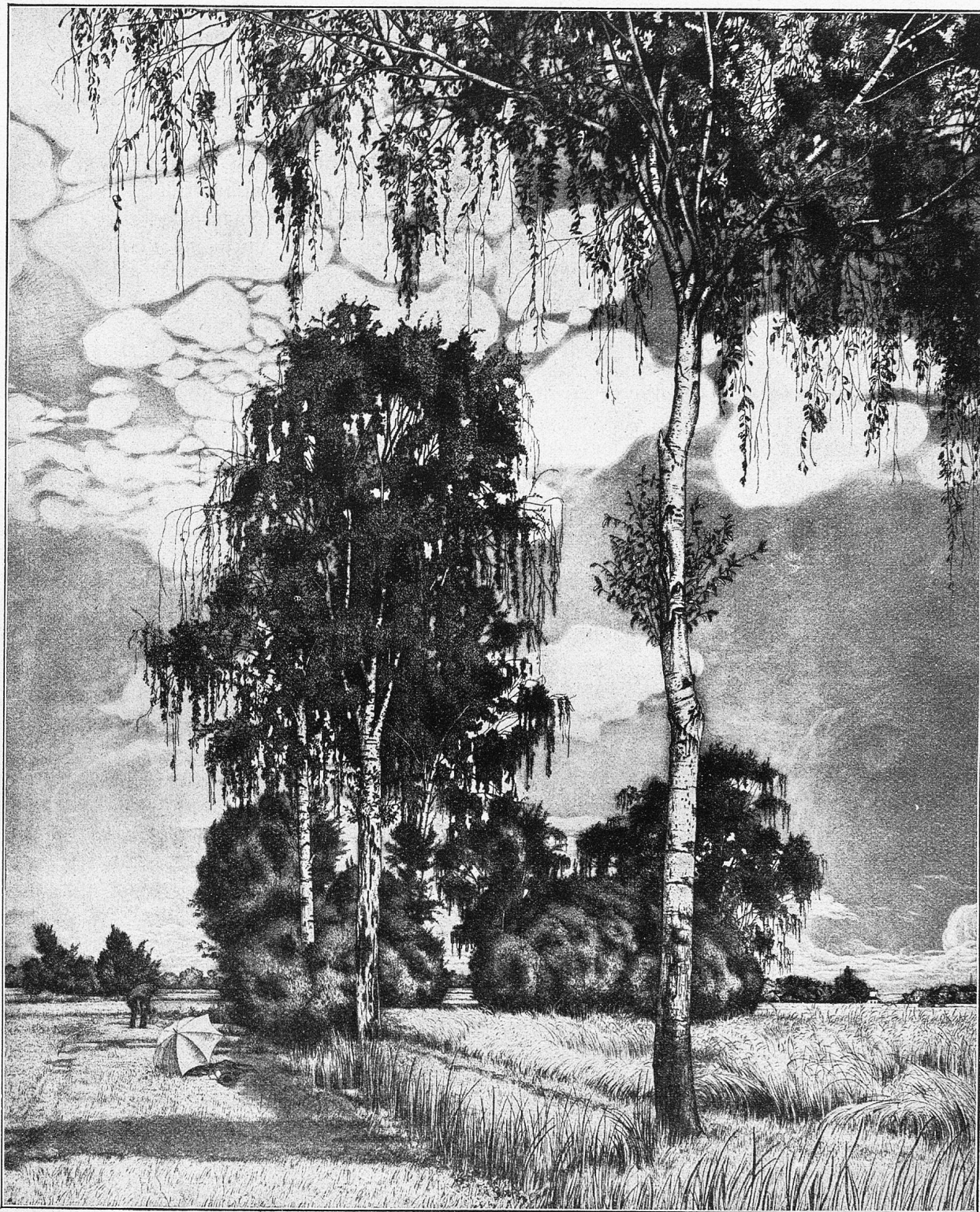
„Pfingsten, das liebliche Fest . . .“ Nach einer Zeichnung von R. Müller.