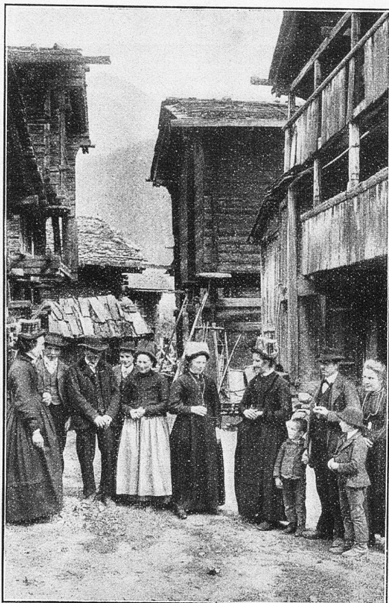
Gomsers im Sonntagsstaat.

gib uns Gnade, daß wir sie zu deiner Ehre gebrauchen durch unsern Herrn Jesus Christus, Amen." Nach dem Essen: „Herrgott, himmlischer Vater, wir sagen Dir Dank für alle Speis und Trank, die wir von deiner großen Güte empfangen haben, gib uns Gnade, daß wir sie zu deiner Ehre gebrauchen durch unsern