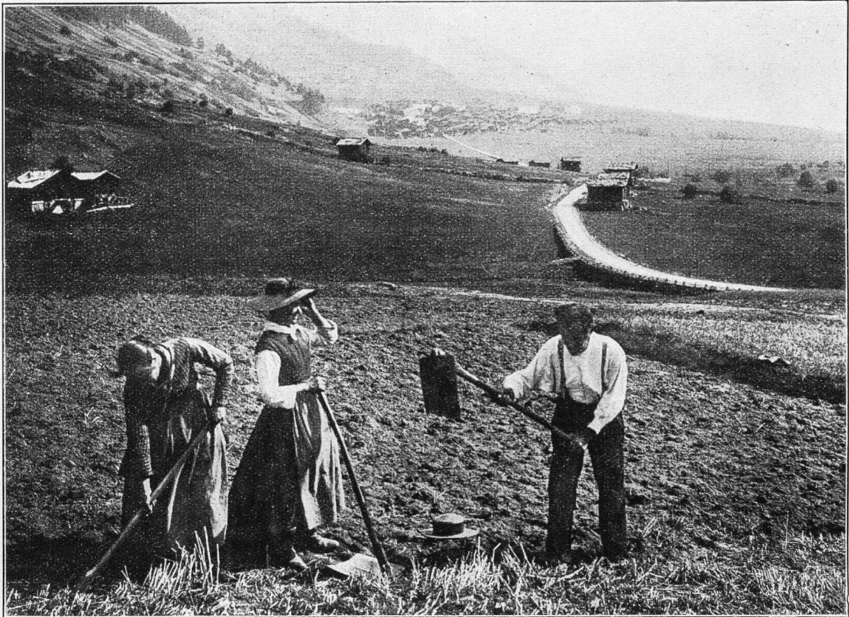
Gomser Bauersleute beim Umgraben des Ackerfeldes mit der Breithaue. Der Pflug wird im Goms nicht verwendet. Im Hintergrund Münster.

Die Habersuppe soll ganz in Abgang gekommen sein. Zu Mittag ißt man Schaf-, Ziegen- oder Schweinefleisch, Brot, Reis oder Kartoffeln und Gemüse und trinkt dazu Schwarzte, schwarzen Kaffee oder Milch. Der „Abet“ (nachmittags 3 Uhr) besteht aus Milchkaffee, Brot und Käse und das Nachtessen aus Minestra, einer Suppe, in der man Kartoffeln, Reis und gelegentlich auch Gemüse