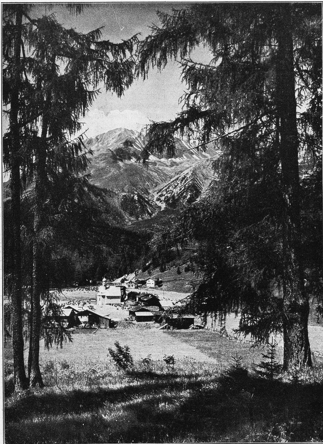
Das idyllisch gelegene Laret bei Davos.