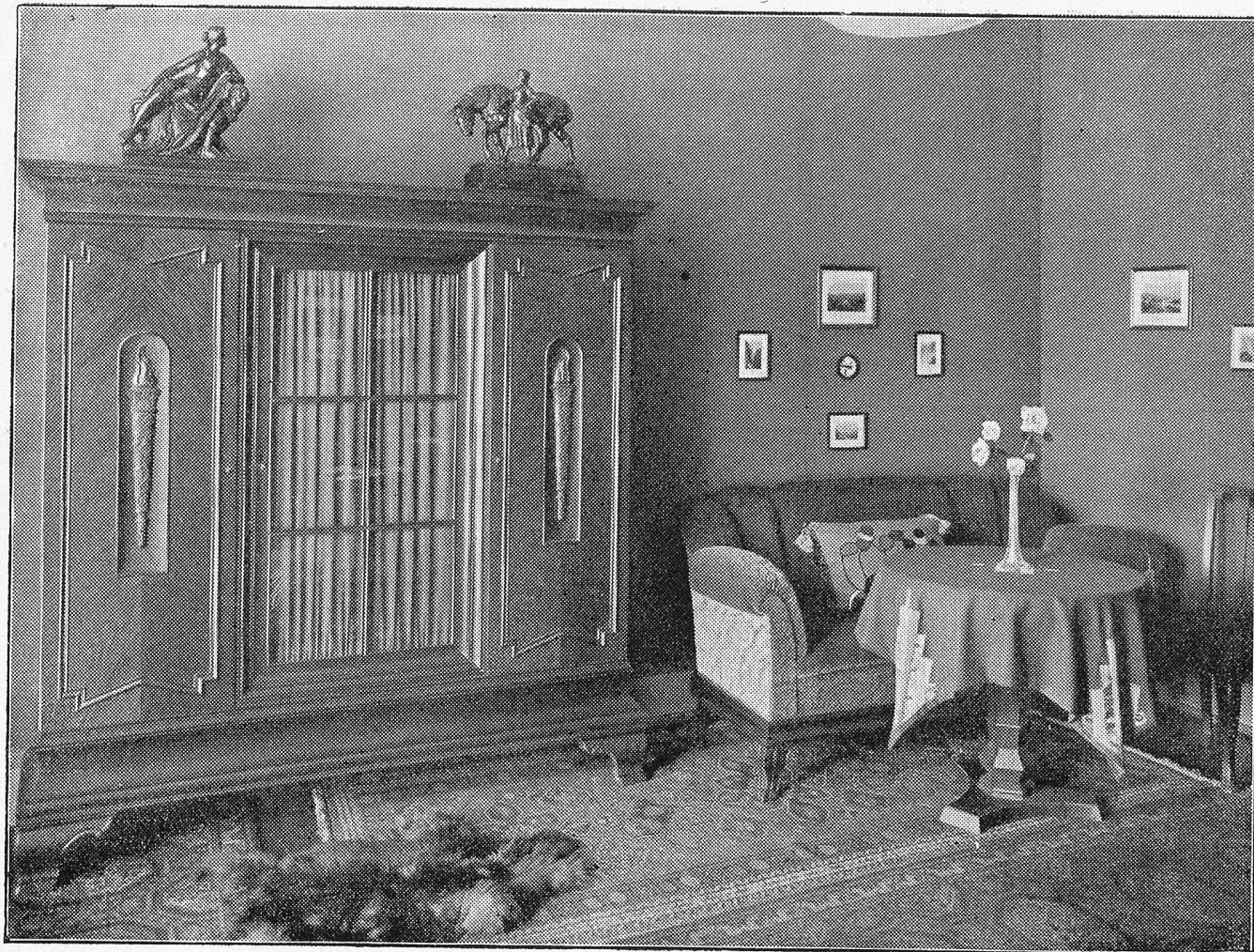
Teilansicht aus einem neuzeitlichen Herrenzimmer in geräuchertem Eichenholz.