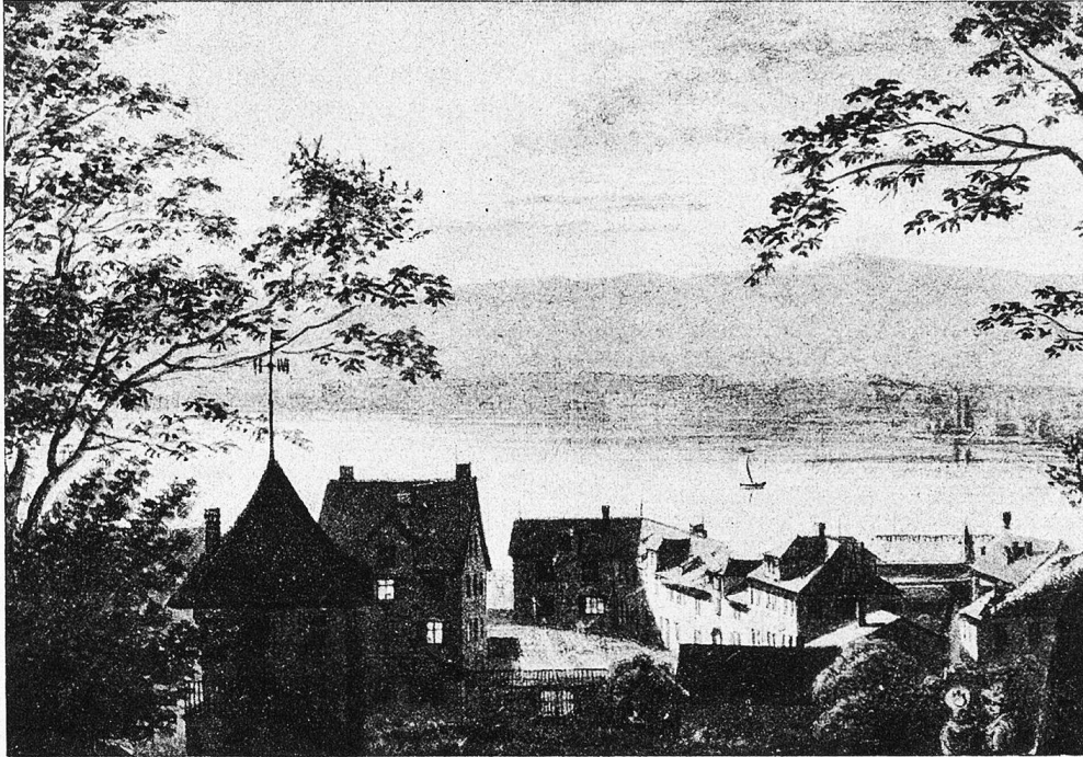
Alter Hof von Stadelhofen.