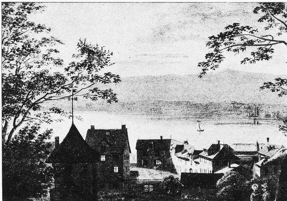
Alter Hof von Stadelhofen.