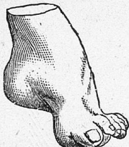
Nur nach Maß.

von Knick-, Platt- und Spreizfüßen, sowie verdorbenen und strupierten Füßen. - Einlagen gegen Knickung oder Senkung des Fußgewölbes nach Maß und ärztlicher Vorschrift. - Sandalenapparate für große Beinverkürzung, Reitstiefel, Sportschuhe.