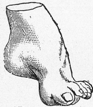
Nur nach Maß.

von Knick-, Platt- und Spreizfüßen, sowie verdorbenen und strüpierten Füßen. - Einlagen gegen Knickung oder Senkung des Fußgewölbes nach Maß und ärztlicher Vorschrift. - Sandalenapparate für große Beinverkürzung, Reitstiefel, Sportschuhe,