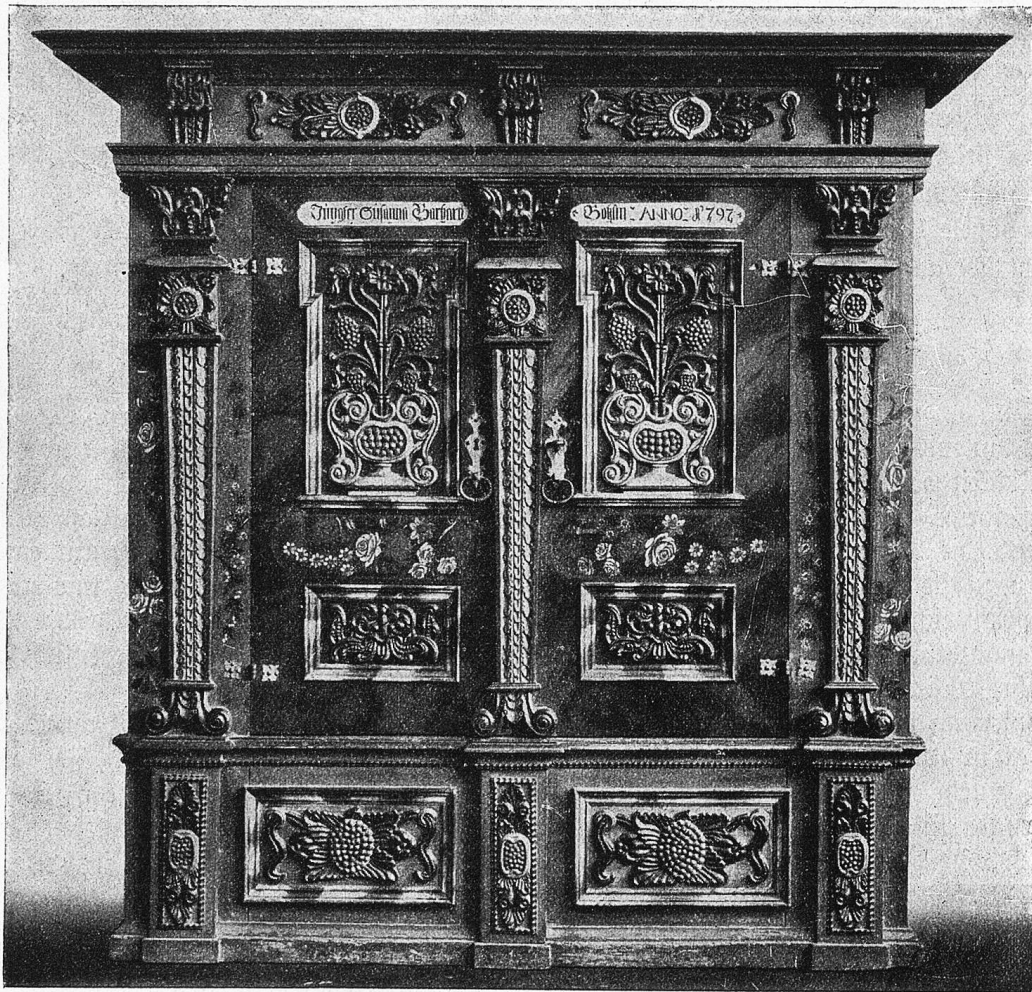
Loggenburger Schrank aus dem Rietbad bei Neßlau, 1797.

Eine geistig rege, an Berufsinteressen des Gatten und der Kinder mit lebhaftem Geist teilnehmende Frau und Mutter gereicht den ihrigen zum doppelten Segen, indem sie nicht bloß für