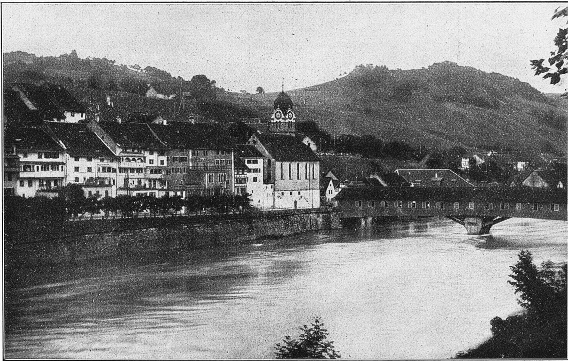
Partie bei Eglisau (Ktn. Zürich)

Einer der Nachbarn mischte sich ein: „Ge-