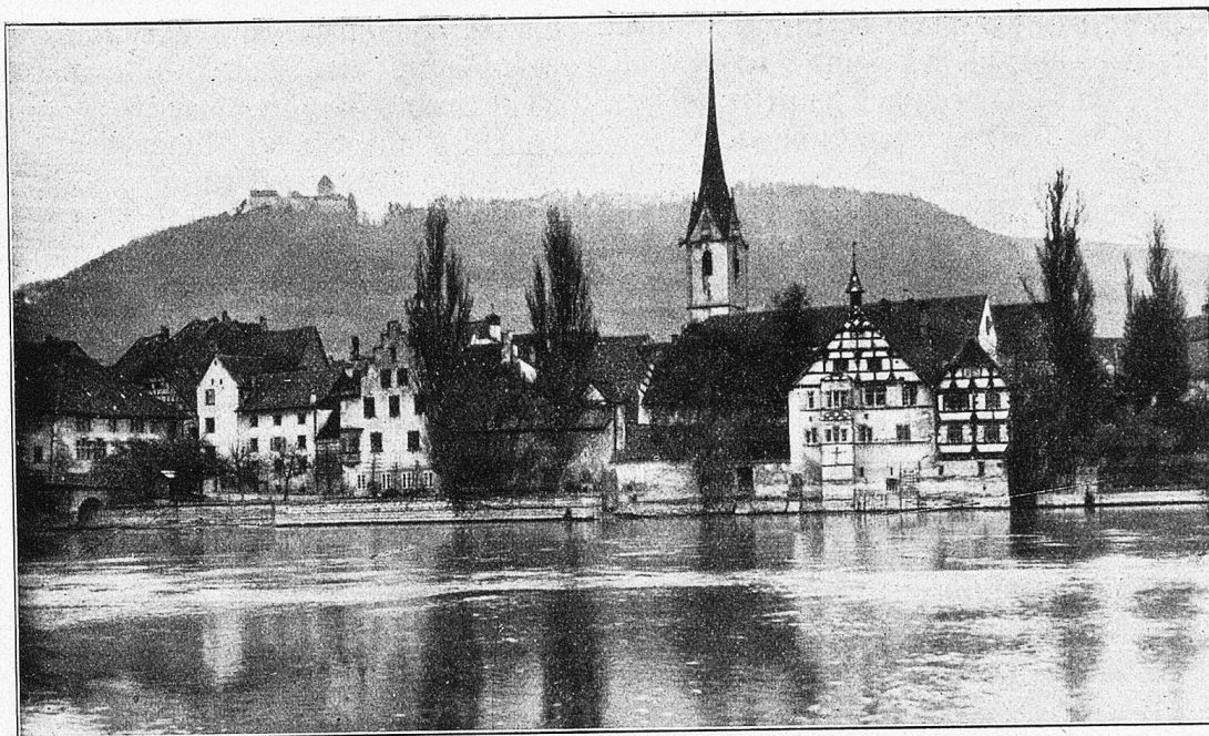
Stein am Rhein mit St. Georgen, im Hintergrund Hohenklingen.

Das ertrug er jetzt nicht. Er schritt oben am Dorf vorbei und ins Tal hinein, stundenlang, an der Kapelle vorüber, von der er neulich geträumt hatte und die ihn jetzt von ihrem hohen Felsen herab zu höhnen schien. Er stieß auf Arbeiter, die in dem wilden Bergbach Holz flößten, tief im eiskalten Wasser standen und festgerammte Fichtenflöße mit schweren Eishaken in die Strömung rissen. Er erkannte unter ihnen Anian, den Sohn des Wegwartes