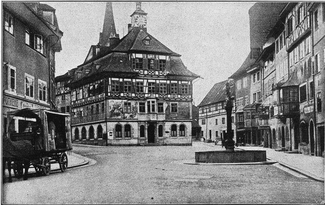
Rathaus in Stein a. Rh.

Sie hatte mit einer Stimme gesprochen, die Josua an ihr nicht kannte, die er dem „Kühlapparat“ gar nicht zugetraut hätte. Er blickte sie von der Seite an. Ihre Wangen waren gerötet, ihre Lippen bebten leicht unter ihren Worten. Nun war ihm mit einem Schlag ihr Geheimnis enthüllt. Er griff nach ihrer Hand, wie man nach einem Menschen greift, den man