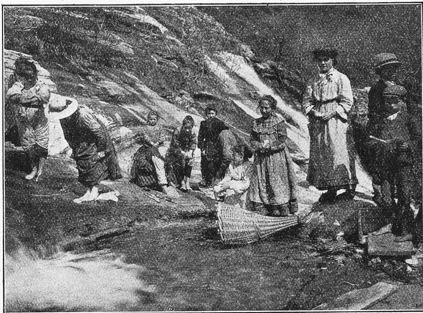
Das Waschen der Wäsche mit den Füßen (Eigentümlichkeit vom Onfernonetal).

Aber schon aus Eitelkeit sollten wir doch unseren Kindern diesen von uns ja nicht gewollten und doch so oft gewährten, aber leicht vermeidbaren Einblick in unsere innersten Angelegenheiten nicht gestatten. Denn es bleibe dahingestellt, ob die Erkenntnis, die im stillen das scharf beobachtende Kind über seine Eltern und Erzieher davonträgt, gerade immer schmeichelter Art ist. Es ist kein Wunder, wenn die Auto-