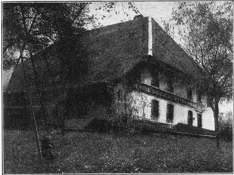
Aus Rölliken im Aargau.

auf eine unerklärliche Weise angetan hat, wieder vom Leibe reißt, sah und fühlte er sich wieder als der ängstliche, gänzlich unbedeutende Spezierer, der er Jahre hindurch gewesen war und den ein anderer auf eine kurze Spanne Zeit verdrängt hatte. Und nun war diese Zeit um und niemand außer ihm ahnte es und zu niemandem konnte er davon sprechen, ohne mißverstanden, ja ausgelacht zu werden. Jrgend etwas in ihm selbst wehrte sich ebenfalls gegen diese neuerliche Verwandlung. Er stand vor