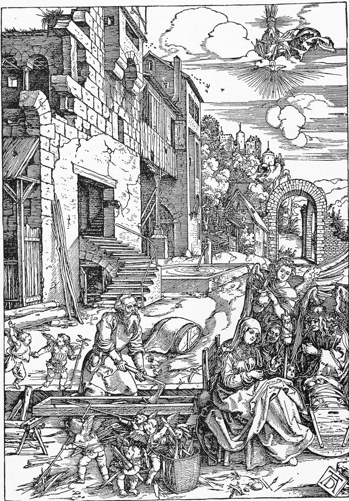
Albrecht Dürer: Jesu Kindheit.