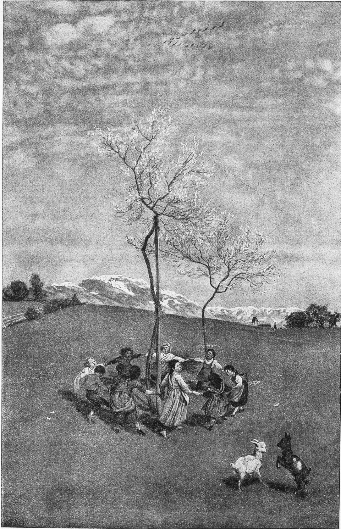
Hans Thoma: Frühlingsreigen.