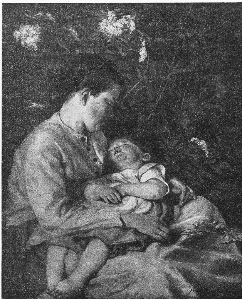
Hans Thoma: Mutter und Kind.

Die Scharen des Volkes folgten dem Zug. Als der Bräutigam die Schwelle der Kirche betrat, schwieg die Musik. Ein paar Duzend Pi-