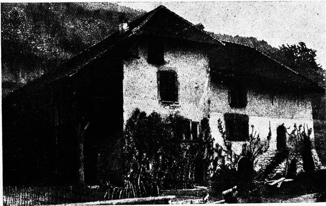
Das älteste Haus in der Schweiz, das sog. Heidenhaus bei Oberhofen a. Thunersee.