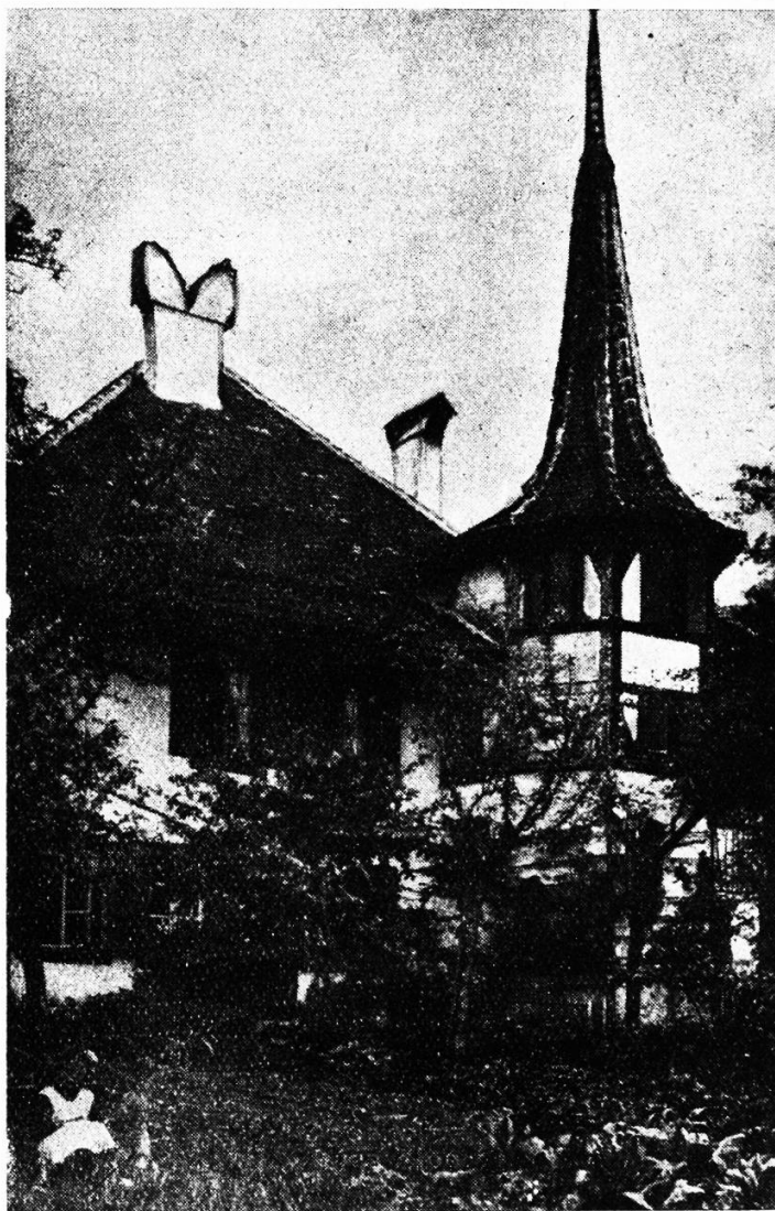
Altes Kloster bei Oberhofen am Thunersee.

Der ehemalige zürcherische Bauerngarten verdankte sein Dasein einer altväterlich behaglichen, wurzelecht mit der Heimat verbundenen Lebensauffassung unserer Vorfahren. Mit dem Zeitalter der Eisenbahnen, des Telegraphen und Telephons, mit der starken Vermehrung der Bevölkerung und der damit zusammenhängenden Verschärfung des Existenzkampfes, verschwand aber größtenteils die Gemächlichkeit und biedermeierische Behaglichkeit, deren sich unsere Vorfahren noch vor wenigen Jahrzehnten erfreuten. Das Hasten und Sagen nach materiellen Gütern hatte eine Verflachung des Familiensinnes zur Folge; die ererbten, als Andenken an Eltern und Großeltern freundlich gehegten Blumen gingen allmählich ab; der Sinn für die stille Poesie des Blumen Gartens, in welchem sich ehemals eine dem Volk selbst unbewußte, feine Naturempfindung ausdrückte, schwand. Wohl trifft man auf den Dörfern heute noch zahlreiche Blumengärten; aber in ihrer Pflege sowohl als in ihrem Aussehen hat sich ein starker Wandel vollzogen. Selten bemerkt man noch die treue Hingabe von ehemals, selten auch jenen Eifer, mit dem die Mütter jeden unerwünschten Eingriff ihrer Kinder in die Fülle des stillen Gärtchens abwehrten, gemäß den Worten: