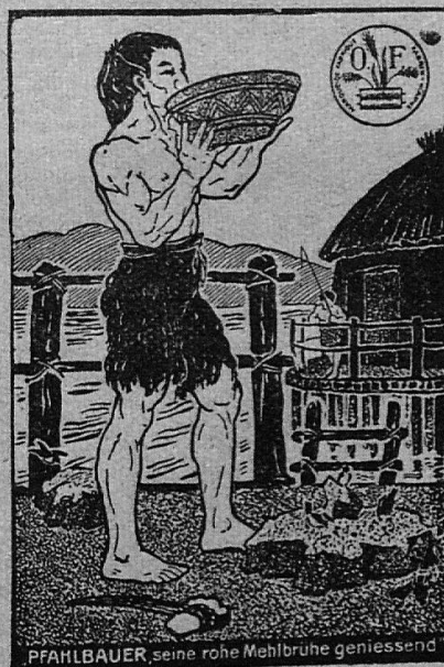
PFAHLBAUER, seine rohe Mehlbrühe genießend

Zu beziehen in allen bessern Spe- zereihandlungen in 1½ Kilo-Packung