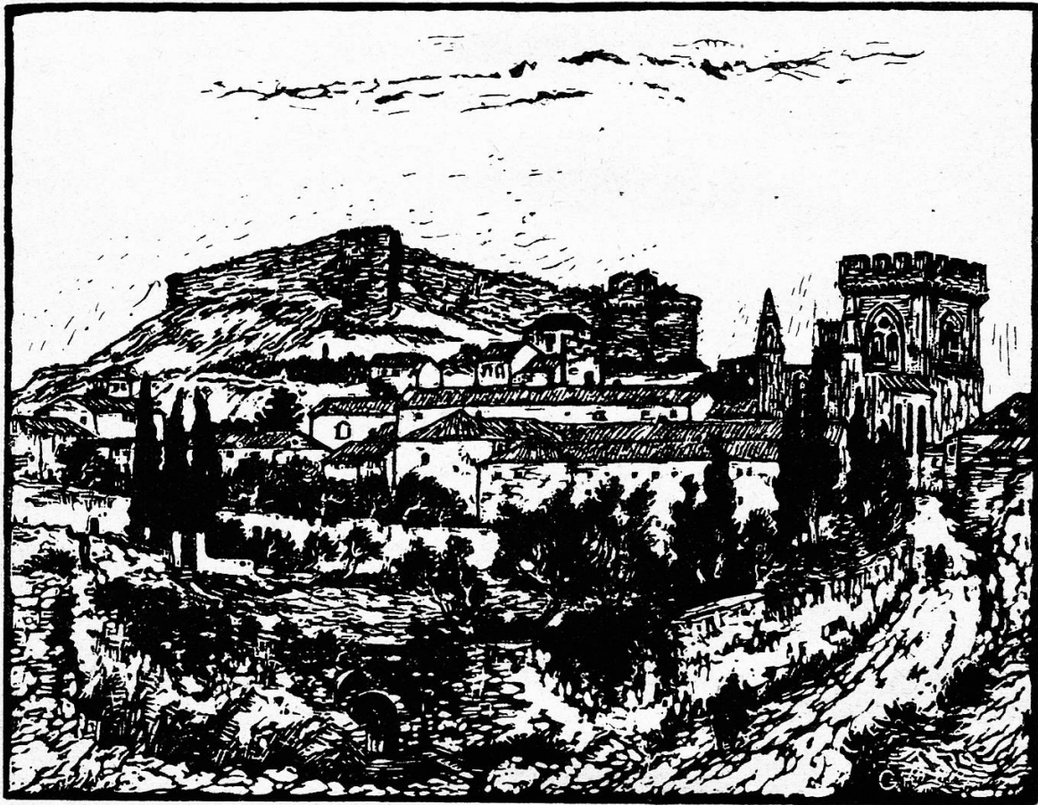
G. Gamper: Südfranzösische Stadt.

Dreimal faßte Lebelang den Griff seines Schwertes fester an, aber das Wort des Vaters wurde immer mächtiger in ihm und überwand die Rache- gedanken. Und auf einmal verstand Lebelang auch den dunkeln Sinn der Rede, und erkannte, daß Haß das größte Unglück der Menschen ist. Er