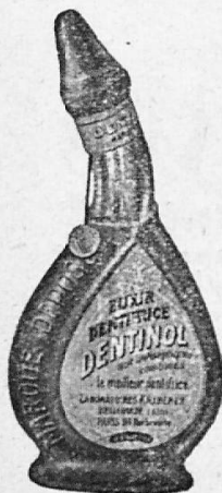
Flasche Fr. 5.25. 1/2 Fl. Fr. 2.75. 1/4 Fl. Fr. 1.50.

Kollektiv Goldene Medaille Landesausstellung Bern 1914.