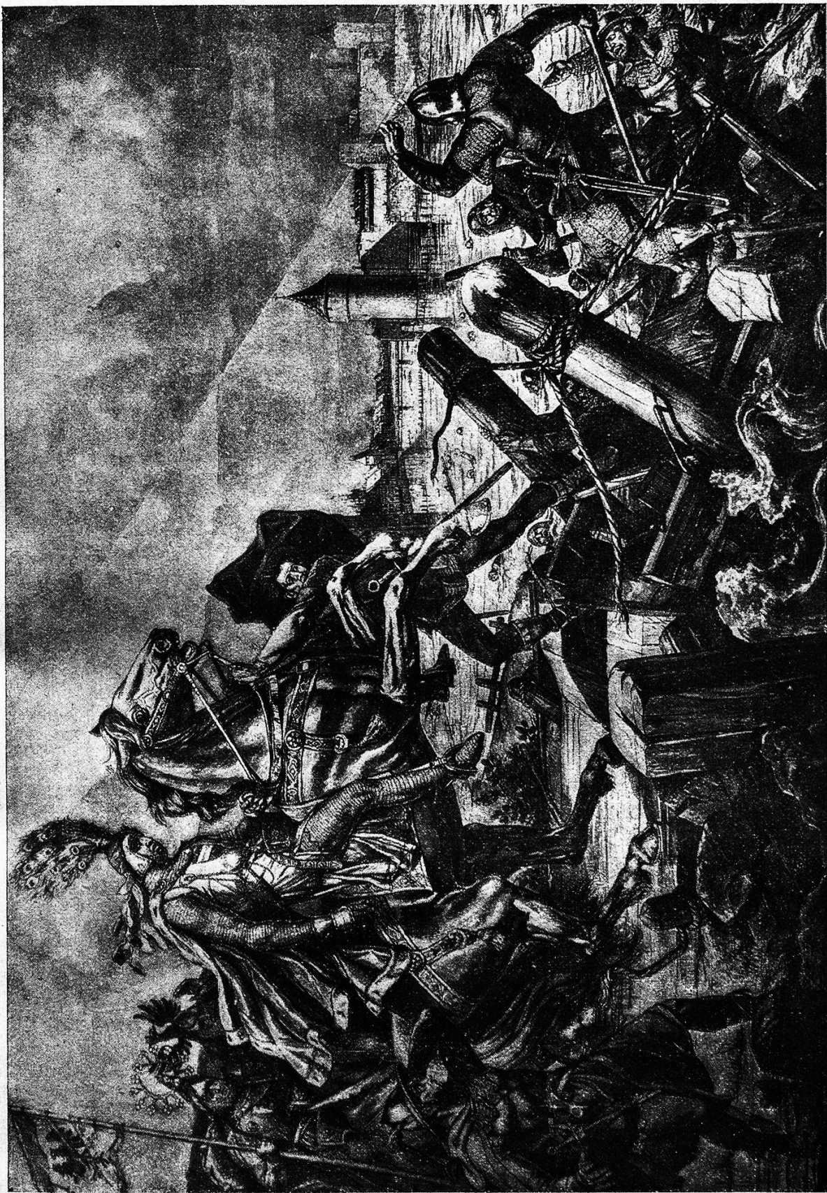
Zur Erinnerung an die Belagerung Solothurns durch Leopold von Oesterreich 1318. Die Brücke, welche die Oesterreicher oberhalb der Stadt geschlagen hatten, wurde, obwohl sie mit Steinen beschwert worden, von der plötzlich angeschwollenen Aare weggerissen. Die großmüthigen Solothurner vergaßen den Zorn gegen ihre Feinde und retteten viele.