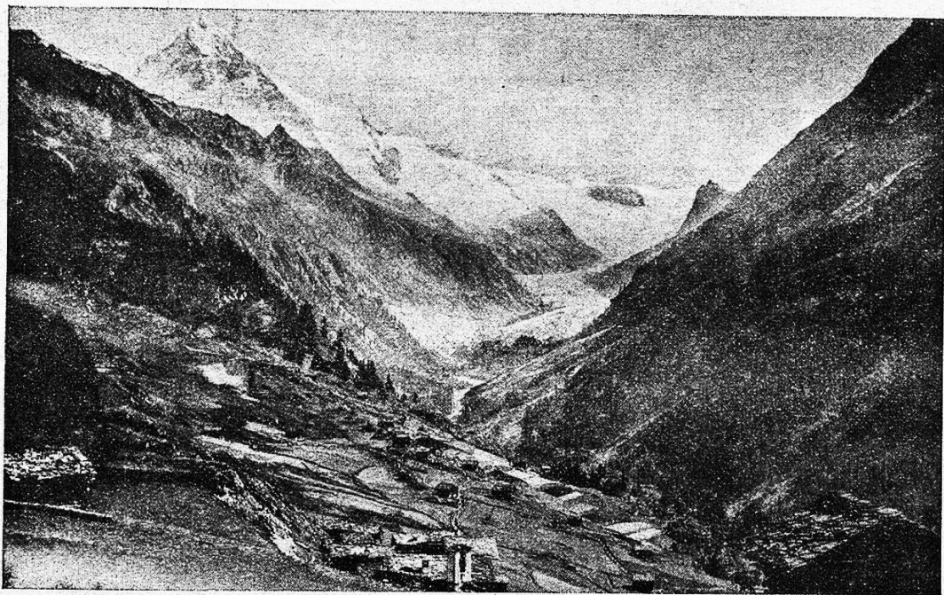
Das Tal von Ferpècle und die Dent-Blanche.

Aber endlich kam's doch und im heimeligen Hotel zur Dent-Blanche, im fröhlichen Geplauder an der wohlbesetzten Tafelrunde und im weichen, warmen Bett und gesunden, tiefen Schlaf erneut sich Körperkraft und Wanderlust, und früher als tags zuvor ging's diesen Morgen wieder die schnurgerade Straße auf Gaudères zu. Am Dorfbrunnen sind sie auch schon geschäftig, unter mächtigem Holzdach sprudelt das kalte Wasser in starkem Strahl in den geräumigen Trog und auf großen Steinplatten reiben und quetschen ihre Wäsche des Dörfchens geschwätzige Weiber.