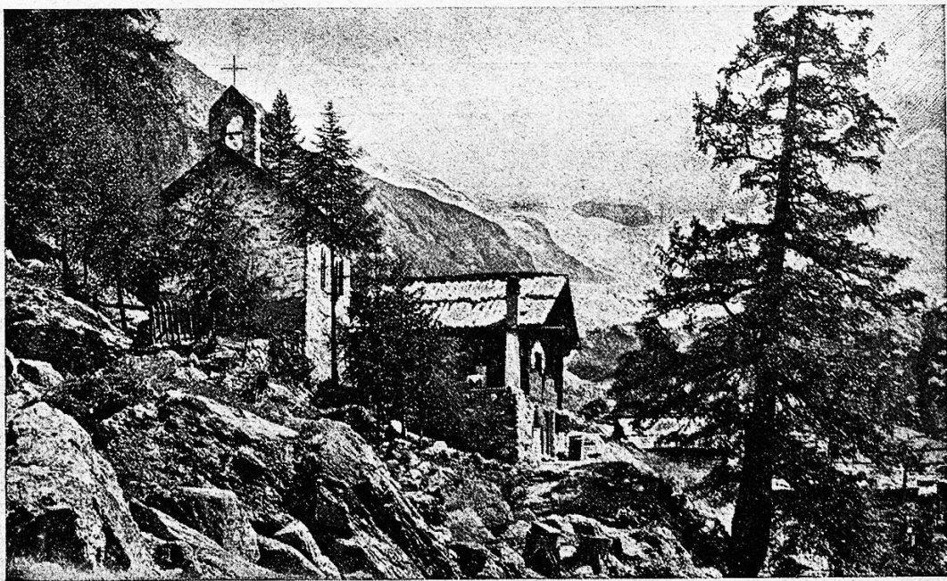
Die Kapelle in Ferpèche.

So wandern wir leichten Fußes und frohen Herzens durch diesen Naturpark Ferpèche zu, aber noch liegt's durch einen quer durch's Tal sich schiebenden Bergrücken unsern Blicken verborgen. Losend zwingt sich der wildschäumenden Bach in tiefgefressenem Bett durch die enge Talschlucht. Da wird der Ausblick mit einem Male frei, die schier unheimliche Felsenwildnis macht der freundlich-grünen, sanft abfallenden Berghalde Platz, und über sie hin zerstreut liegen die schindelbedeckten, steinbeschwerten wenigen Holzhütchen von Ferpèche. Gleich im Anfang des armseligen Dörfchens steht das kleine Hotel du Col d'Hérens, von der Holzgalerie schauen Kurgäste in den strahlenden Morgen hinein, andere sitzen an langen Tischen auf dem Platz neben dem Häuschen und schlürfen behaglich den wärmenden Kaffee, auch der harte Fels dient als Sitz. Klein und primitiv sind die Räume im niedrigen Häuschen, aber gerade in seiner Einfachheit und Ursprünglichkeit hat das kleine, weltverlorene Örtchen seinen besondern Reiz. Links oben klebt am steilen Abhang eines jener vielen Bergkapellchen, wie wir sie in diesen abgeschiedenen Walliser Tälern so häufig finden, im dunkeln Arben-