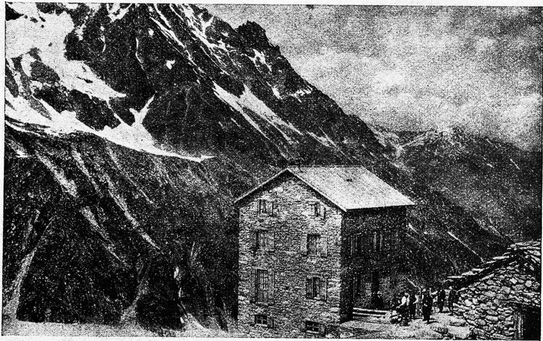
Hotel-Restaurant Bricolla, 2426 m.

Lange lagen wir hingestreckt auf grünem Rasenteppich, ganz nahe am Schnee, im strahlenden, wärmenden Sonnenschein und haben hinauf und hinab geschaut. Welch' riesige Schnee- und Eismassen liegen noch auf der Dent-Blanche. Nach Westen fällt sie zum Ferpècle-Gletscher sanfter ab; man sollte nicht meinen, daß sie gerade von dieser Seite her am schwierigsten zu erklettern sei: Von ihren Wänden donnern Lawinen zu Tal und Sturzbäche rauschen über Felsen. Aber auch aus der Tiefe rauscht's und braust's zu unserer stillen Höhe hinauf. Im Eisleib des Ferpècle-Gletschers ist's lebendig, und das Tosen der Gletscherbäche dringt bis an unser Ohr. Kühl weht der Wind von den schneeigen Riesen über unsere Höhe und die tausend Blu-