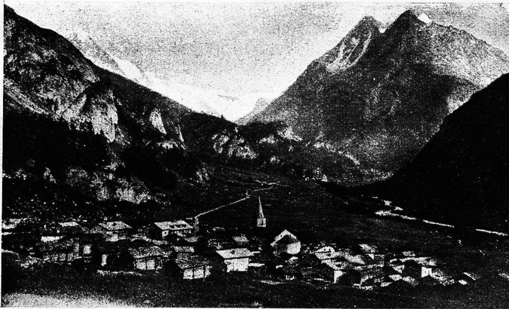
Evolene mit den Weißbühlhörnern.

Heiß brennt die Sonne auf den gegenüberliegenden Talhang und von hoch oben grüßen die niedlichen Häuser von Vernamiège herüber, noch weiter nach vorn auf der Bergkuppe, die steil zum Rhonetal abfällt, klebt die Häusergruppe von Nar, und immer noch höher als all' diese sonnenverbrann-