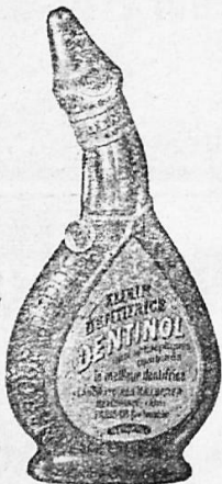
Flasche Fr. 4. 1/2 Fl. Fr. 2. 1/4 Fl. Fr. 1.25.

Spezialpreise für Hotels und Pensionen. Union-Kaffee-Gesellschaft Schaffhausen.