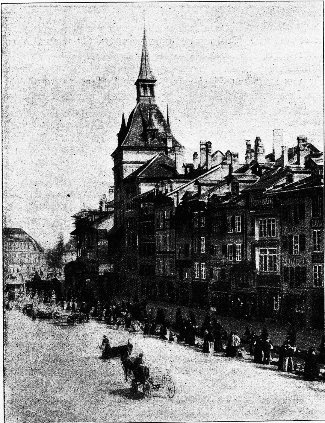
Der Markt in Bern.

Doch ein Vorbereitungsbefehl kommt die Schützenlinie entlang: „Der Zug links wird einen Sprung machen!“ Pünktlich geben Sie ihn weiter, und er erreicht Ihren Leutnant, der den Arm emporhebt zum Zeichen, daß er den Befehl erhalten. Sie aber schauen mit großem Interesse nach links.