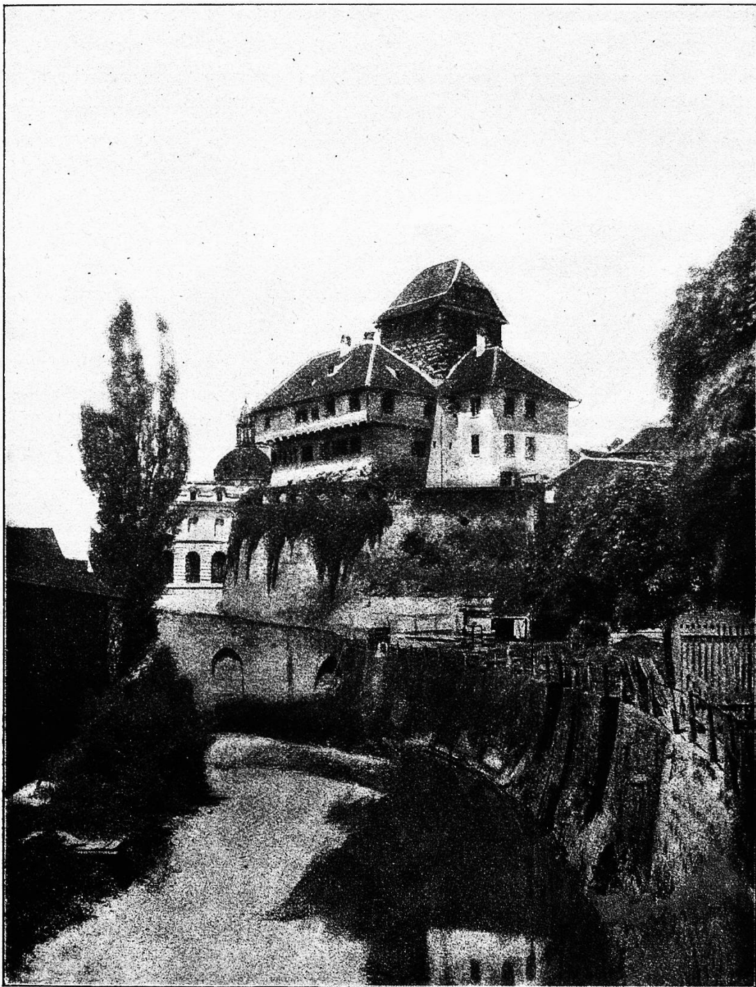
Das Schloß in Frauenfeld.

Und Sie können zu sich selber sagen: „Zwar bin ich nur ein einfacher Infanterieleutnant; doch ist mir ein Teil des Schlachtfeldes, so klein es auch