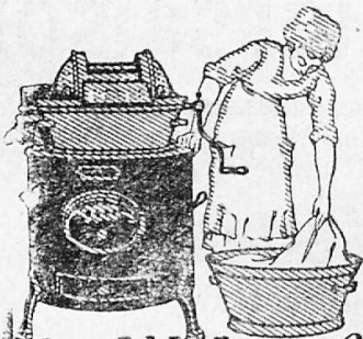
Johns „Voldampf“ Waschmaschine rund mit Wasserschiffen

Sie diese Nachteile durch Benutzung einer Orig. Johns „Voldampf“ Waschmaschine mit Wasserschiffen. Sie erzielen bei schonendster Behandlung des Waschgutes bedeutende Ersparnisse an Zeit und Geld. — Schreiben Sie uns wegen der Anschaffungskosten. Jede Anskunft bereitwilligst; event. nach Vereinbarung die Maschine zur Probe. Bezugsquellen werden genannt.