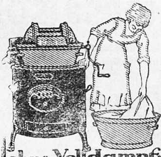
Johns-Valldampf- Waschmaschine rund mit Wasserschiffen

erwachsen Ihnen regelmässig, wenn Sie Ihre Wäsche nach dem altmodischen Verfahren reinigen, durch Reiben mit der Hand, an Riffelflächen von Waschbrettern, oder in Bottichwaschmaschinen.