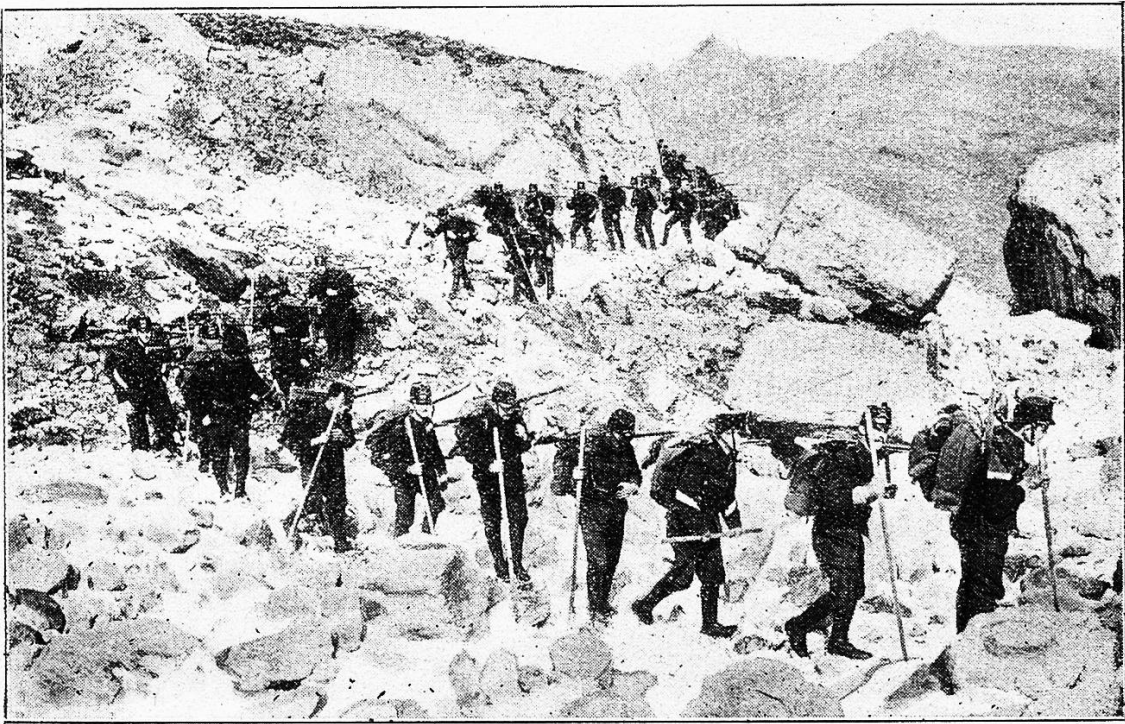
Unsere Gebirgsstruppen im Marsche.

übernommen, mit Schulden, daß sich die Balken bogen in der Scheune. Er aber legte auf die Schulden seine heiße Arbeit. Da schmolz die Schuld. Da lag der Weidenhof blank und unverschuldet in der Sonne. Da nahm er sich ein Weib. Die schenkte ihm das Agathl, drehte sich an die Wand und starb. Um zu vergessen, rackerte er noch ärger als zuvor. Der Weidenhof bekam Hände. Der Weidenhof griff um sich und holte Äcker, Wiesen, ja, ein Stück Wald sogar am Königlichen Forst. Und als er sich genug gestreckt hatte, der Weidenhof, da ging er in die Höhe. Da kam das zweite Stockwerk auf das Haus, da setzte er sich eine Sägemühle an die Ache. Da wurde er des Forst-