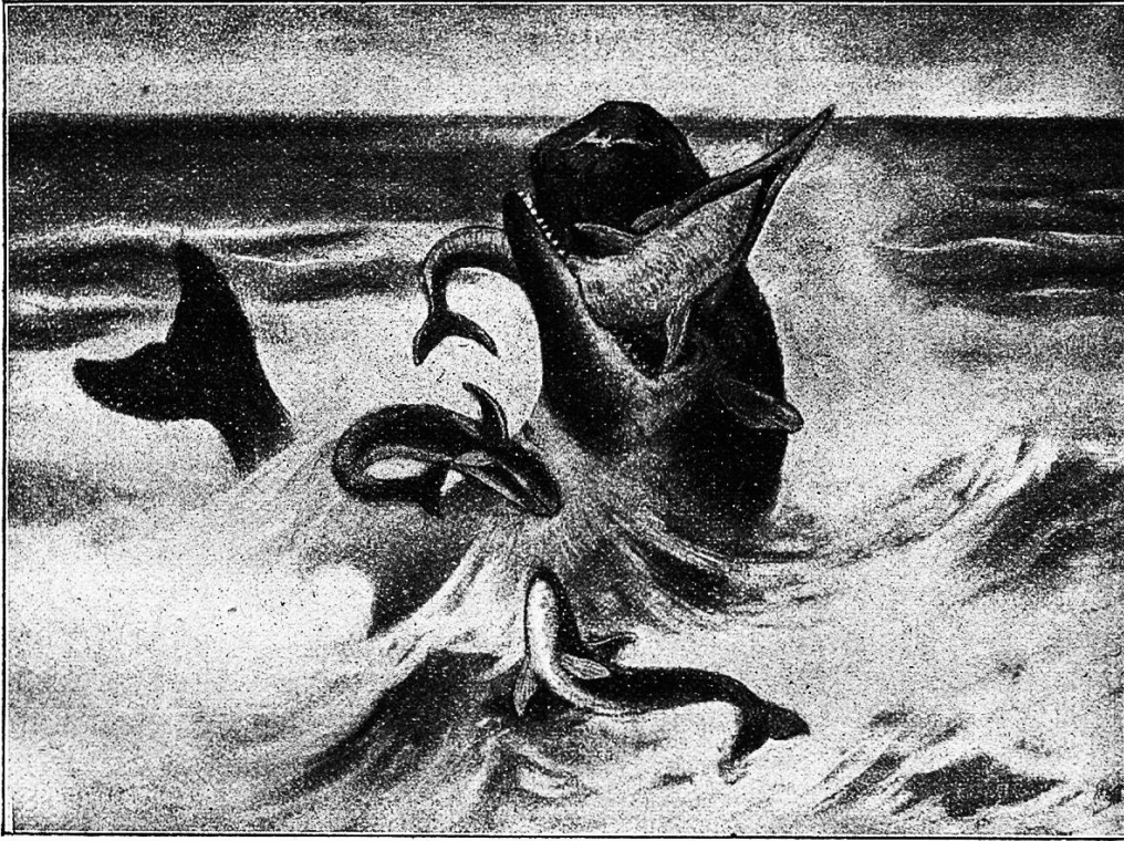
Wie ein großer, grauer Felsblock ragt der plumpe Kopf aus der wirbelnden, schäumenden Flut . . .

Kein Seefahrer hätte bessere Gelegenheit, Einblicke zu tun in noch ungelöste Rätsel der Ozeane, als der Walfischfänger, der die entlegensten Wassermüsten einsucht und manchmal sechs Monate nacheinander und länger gar kein Land in Sicht bekommt. Doch das Augenmerk der Männer, die den Leviathanen nachstellen, ist lediglich auf materiellen Gewinn gerichtet; was