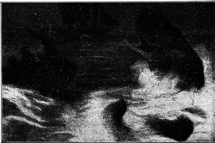
Der mit fest gegen den Saltblock gestemmtem Knie im Bug des Bootes stehende Offizier hebt die Lanze . . .

Wir hatten die Freundschaftsinseln (auch Tongaarchipel genannt, eine Inselgruppe Polynesiens) angelaufen und ein Duzend unserer Kanaken entlassen. Die braunen Burschen waren von einem anderen Walfischfänger angeworben und von diesem mit nach New Bedford gebracht worden; dort hatten