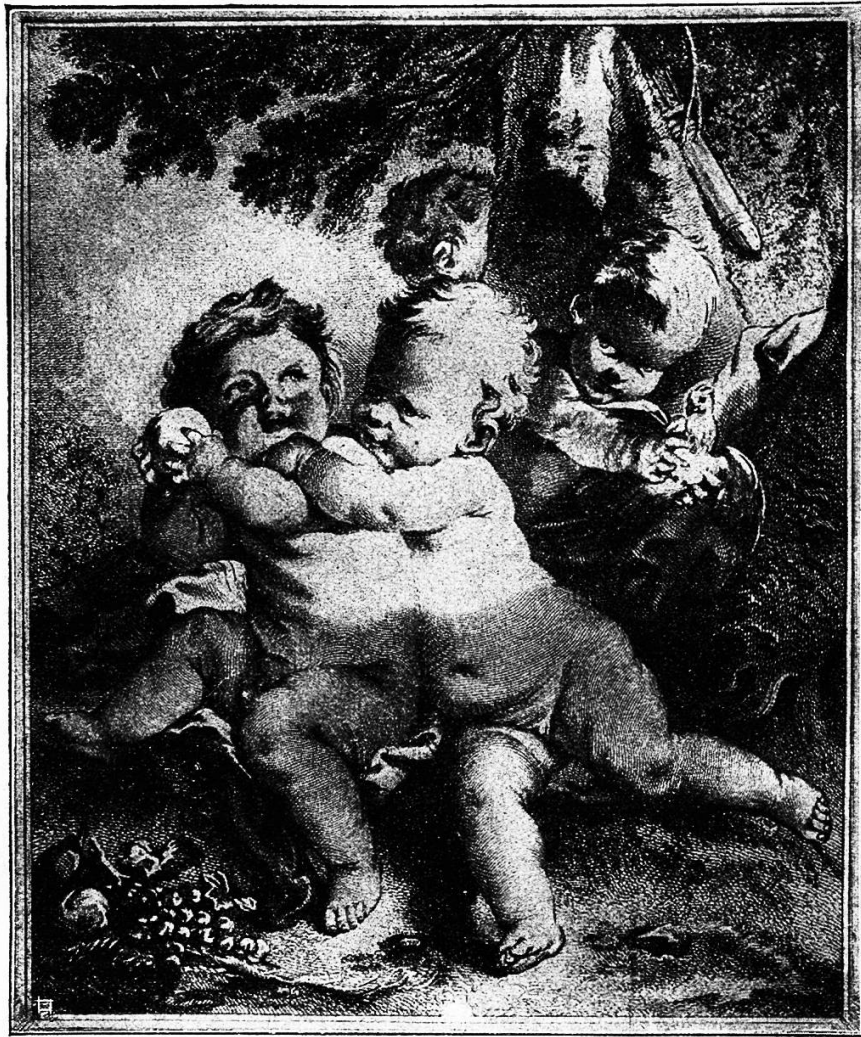
Abb. 5. François Boucher, 1703—1770, Paris.

naissance die Antike ihre ersten Vorbilder. Gestochene und geschnittene Herkulesbilder wanderten dann von Land zu Land. In den Kuppelgemälden der Schlösser des 18. Jahrhunderts werden die Heldentaten des Siegers bis zu seiner Erhöhung im Olymp in leuchtenden Farben geschildert. Die große Bewegung, der herrliche Akt bildet den Inhalt der südlichen Kunst, den tiefen Sinn der Sage sucht die nördliche auszuschöpfen und auszugestalten, indem sie die Geschichten und Begebenheiten erzählt. Sie braucht den Griffel, während die südliche auf große Flächen nur die Gestalten malt. Im allgemeinen sind die Stiche für die weite Welt anregender, lösen mehr Phantasie