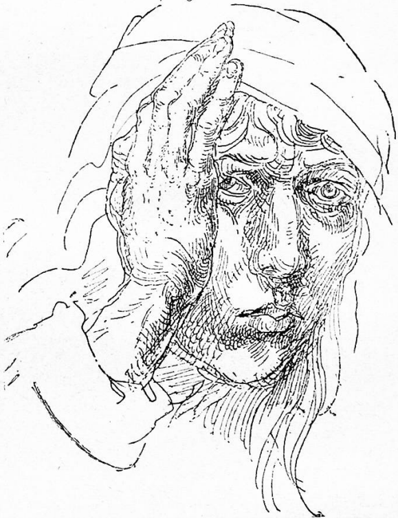
Abb. 2. Albrecht Dürer. Dürer selbst. 20 Jahre alt. (Federzeichnung).

Hier ist es nun ungemein lehrreich, aus der durch die Stellung der Engel bedingten Komposition die Stärke und Wirkung der Bilder zu erkennen. Wie sie durch eine lose oder eine innige Verbindung der Engel mit dem Christuskind oder der Muttergottes bedingt ist. Hier stehen die himmlischen Musikan-