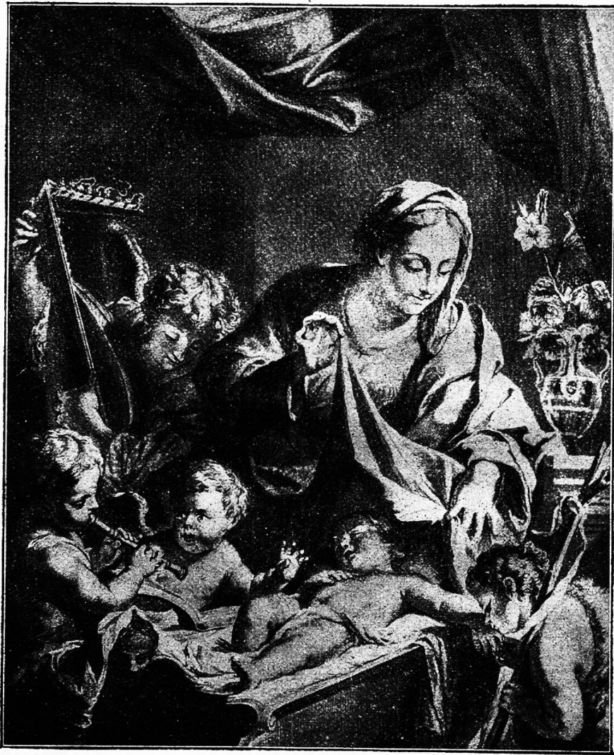
Abb. 1. Francesco Trevisani (1656—1746) Roma. Das Christkind schläft. (Kupferstich.)

Unter diesem Titel erscheint im Verlage von Otto Maier in Ravensburg ein Kunstunternehmen, das vielleicht mehr als jedes andere — wegen der Billigkeit und der geschickten Anordnung — geeignet ist,