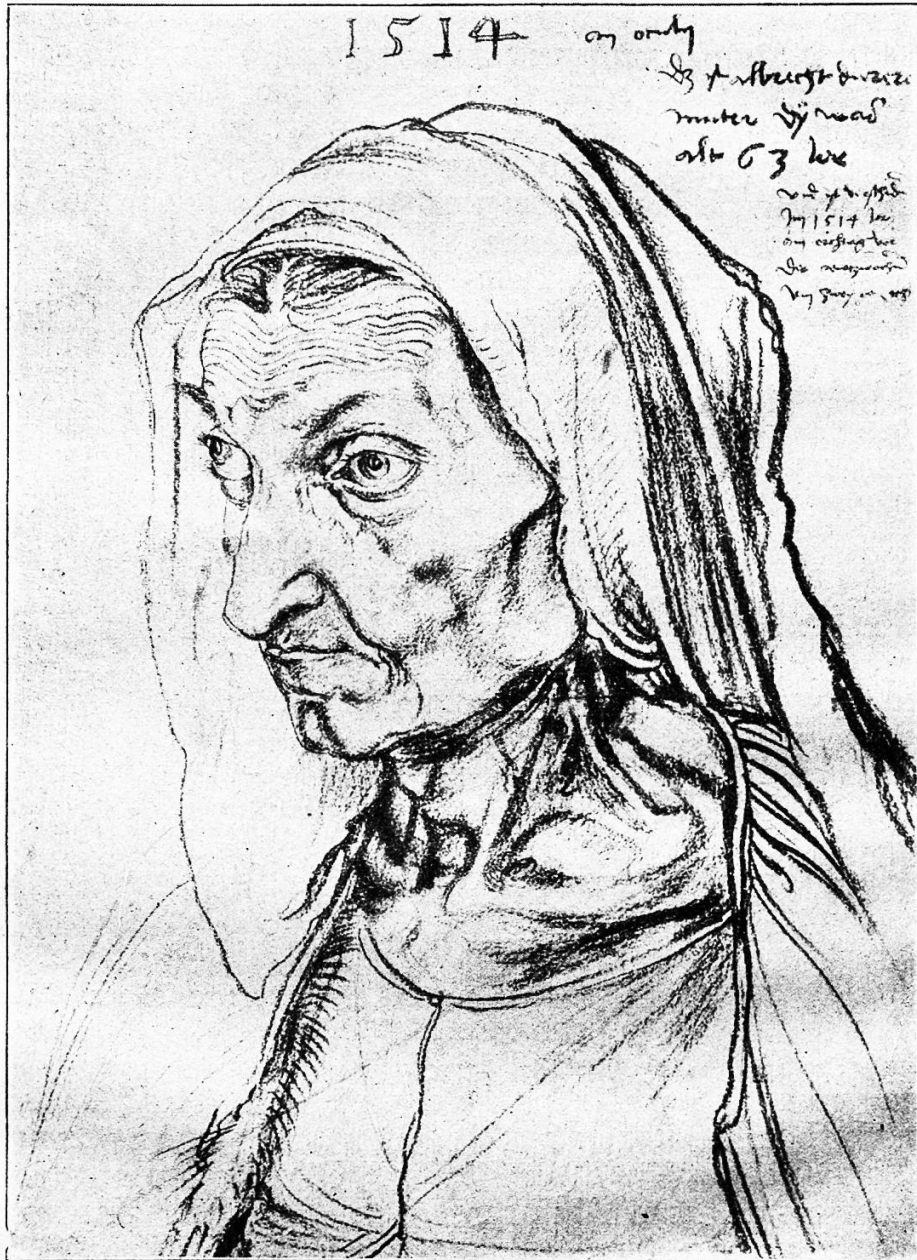
Abb. 3. Albrecht Dürer. Dürers Mutter (Kohlezeichnung) 1514.

Das zweite, Albrecht Dürer gewidmete Bändchen eröffnet der Verfasser mit einer sehr einfachen und doch überzeugenden Lebensbeschreibung des großen Nürnberger Malers, dessen Holzschnitte, Kupferstiche und