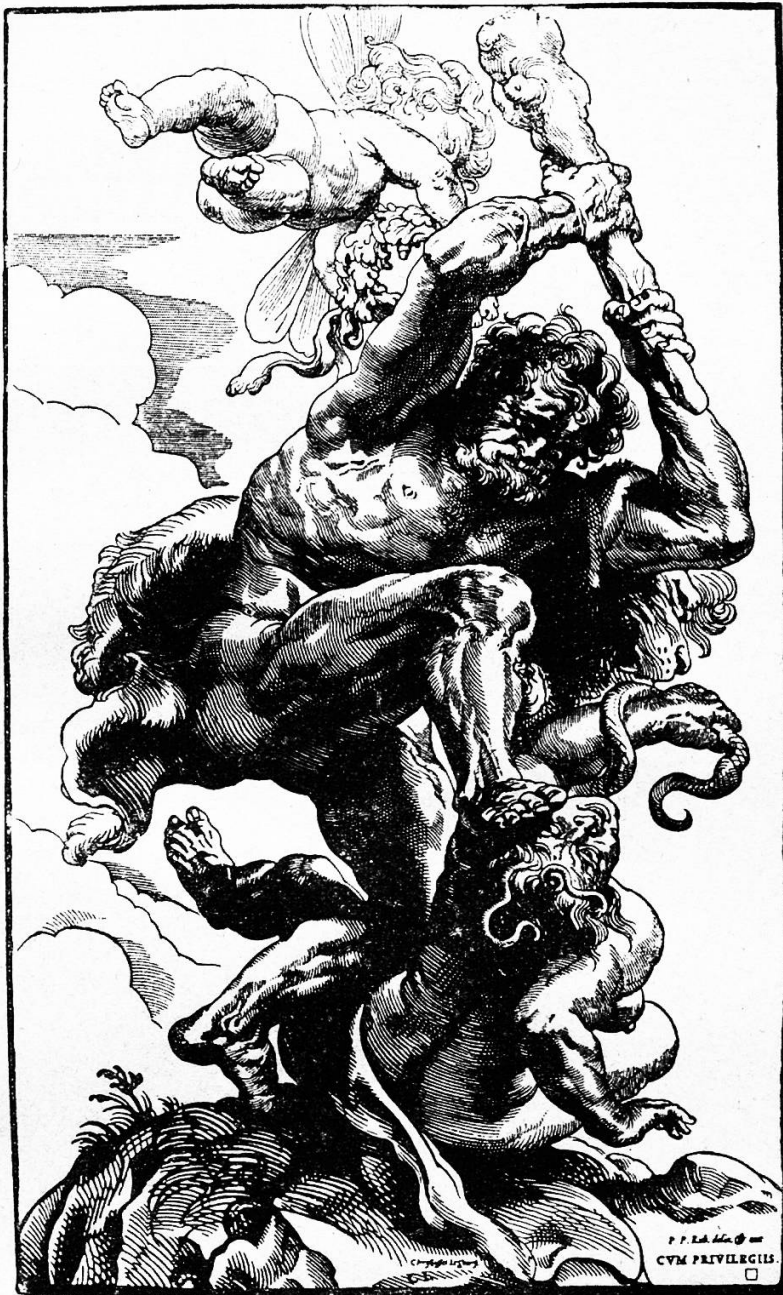
Abb. 4. Peter Paul Rubens (1577—1640) Antwerpen. Herkules über die Zwietracht siegend (Holzschnitt).

In Relief und geschnittenen Steinen lieferte den Künstlern der Re-