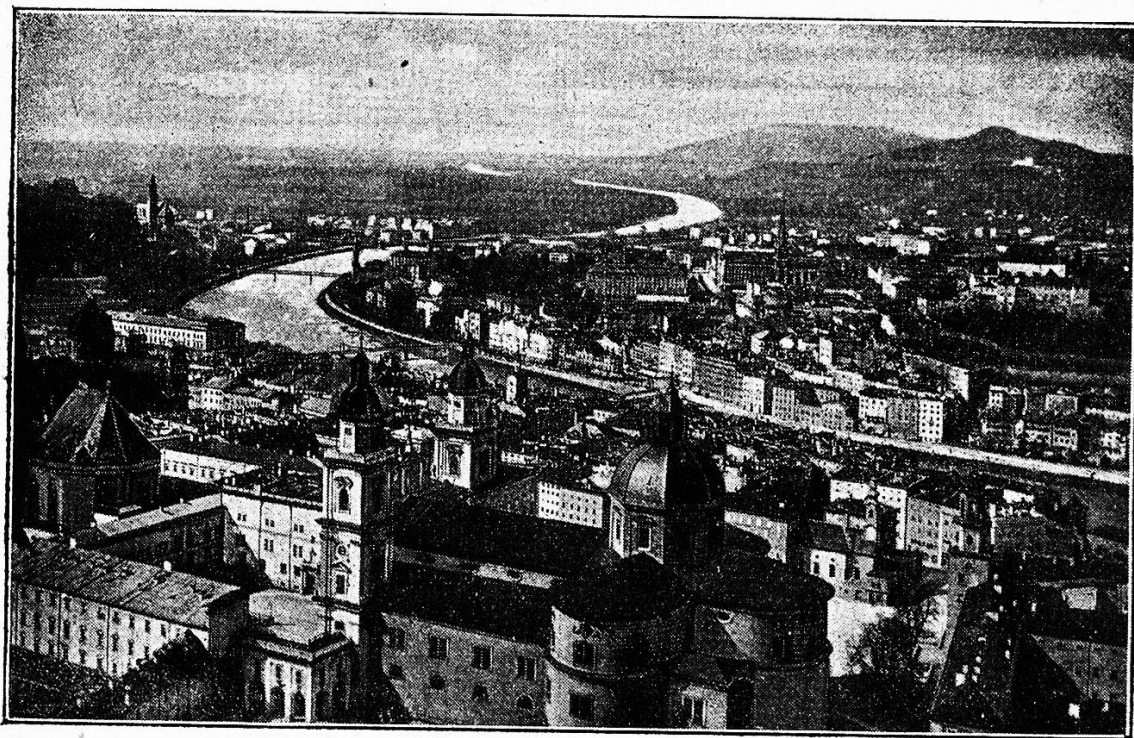
Salzburg von der Festung.

Wie sollte sich da nicht munter und lustig an Kletterstange und Strickleiter, auf Schaukel, Reck und Barren die frische Jugendkraft erproben lassen.