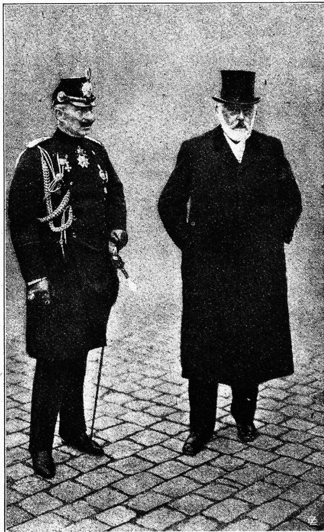
Der deutsche Kaiser und Bundespräsident Dr. F. Forrer.

Ebensowenig ist es für Deutschland gleichgültig, ob wir, wenn es in einen Krieg mit Frankreich verwickelt würde, im