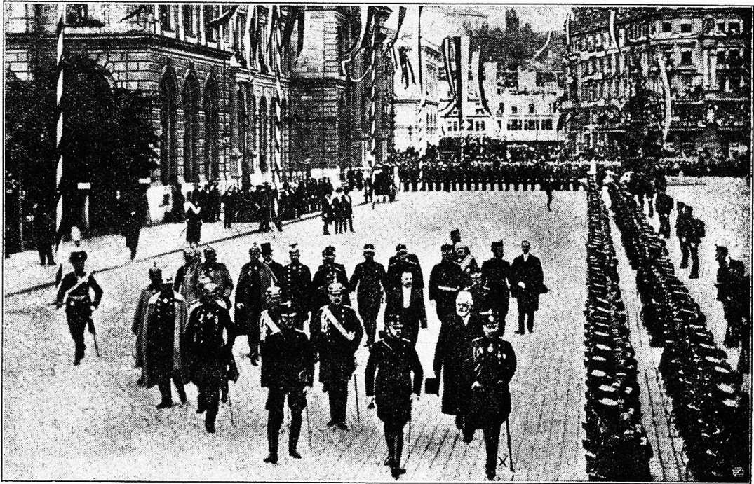
Der deutsche Kaiser schreitet die Front der Ehrenkompanie ab.

stande sind, unsere Neutralität zu verteidigen, unsere Westgrenze gegen französische Heere, die durch die Schweiz in Baden einzufallen bestimmt sind, wirksam zu schützen oder nicht. Deshalb wollte der Kaiser, der ein scharfes Auge für die Kriegstüchtigkeit der Truppen besitzt, unsern Manövern persönlich bewohnen. Unsere Wehrfähigkeit ist für ihn bedeutsamer als die Frage, ob das Milizwesen in Deutschland eingeführt werden könne.