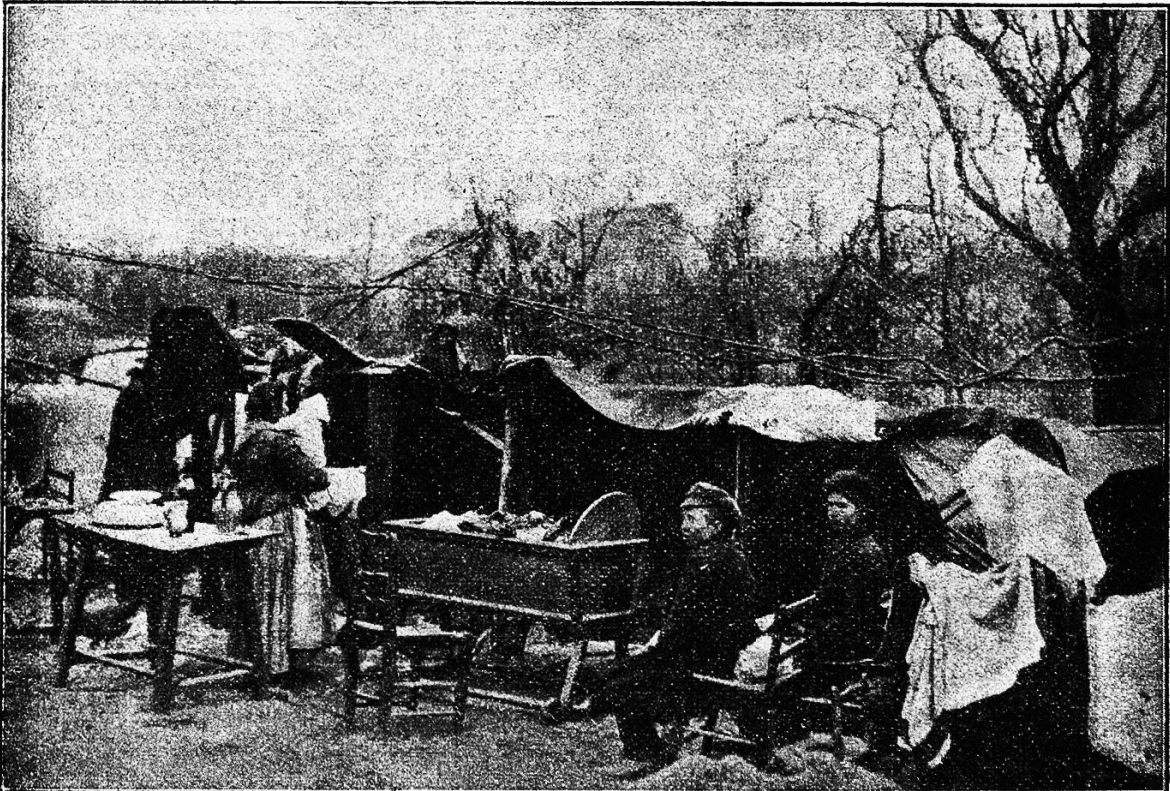
Improvisierte Zeltwohnungen in Messina

Landesteile Italiens gebracht, daß es sich rechtfertigt, auch in einer Zeitschrift, die sonst keine Tagesereignisse registriert, die Erinnerung daran im Bilde festzuhalten. Wenn es angesichts der furchtbaren Verwüstung und der entsetzlichen Vernichtung von 200,000 Menschenleben, die ein ehernes Naturgesetz hervorrief, für die Menschheit einen Trost gibt, so ist es der, zu sehen,