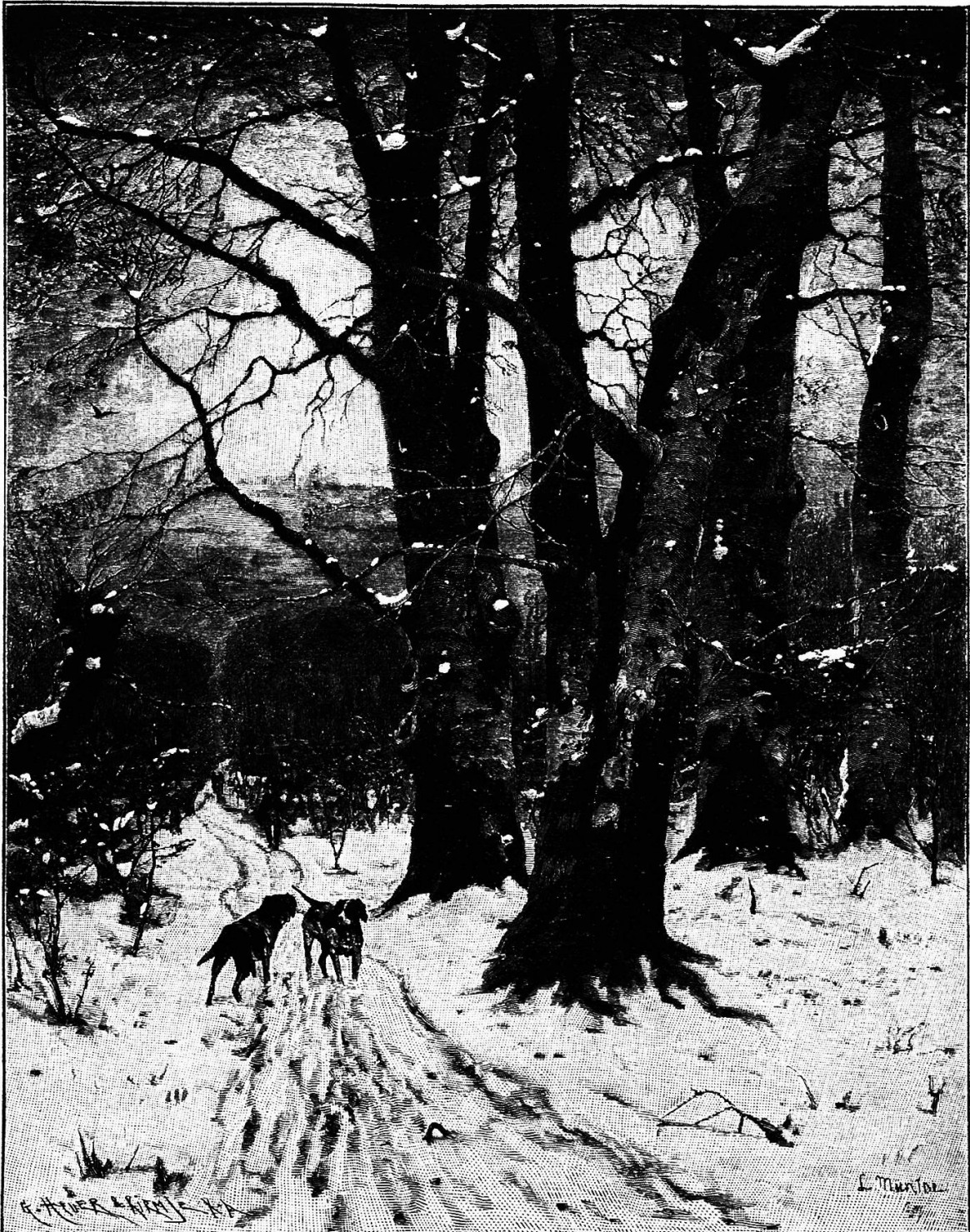
Winterlicher Waldweg. Nach dem Gemälde von L. Munthe.