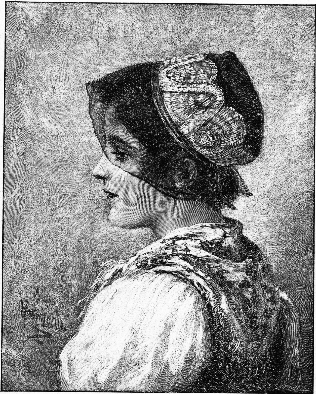
Ein Maikind aus dem Mühlbachtal. Nach dem Gemälde von W. Hasemann.