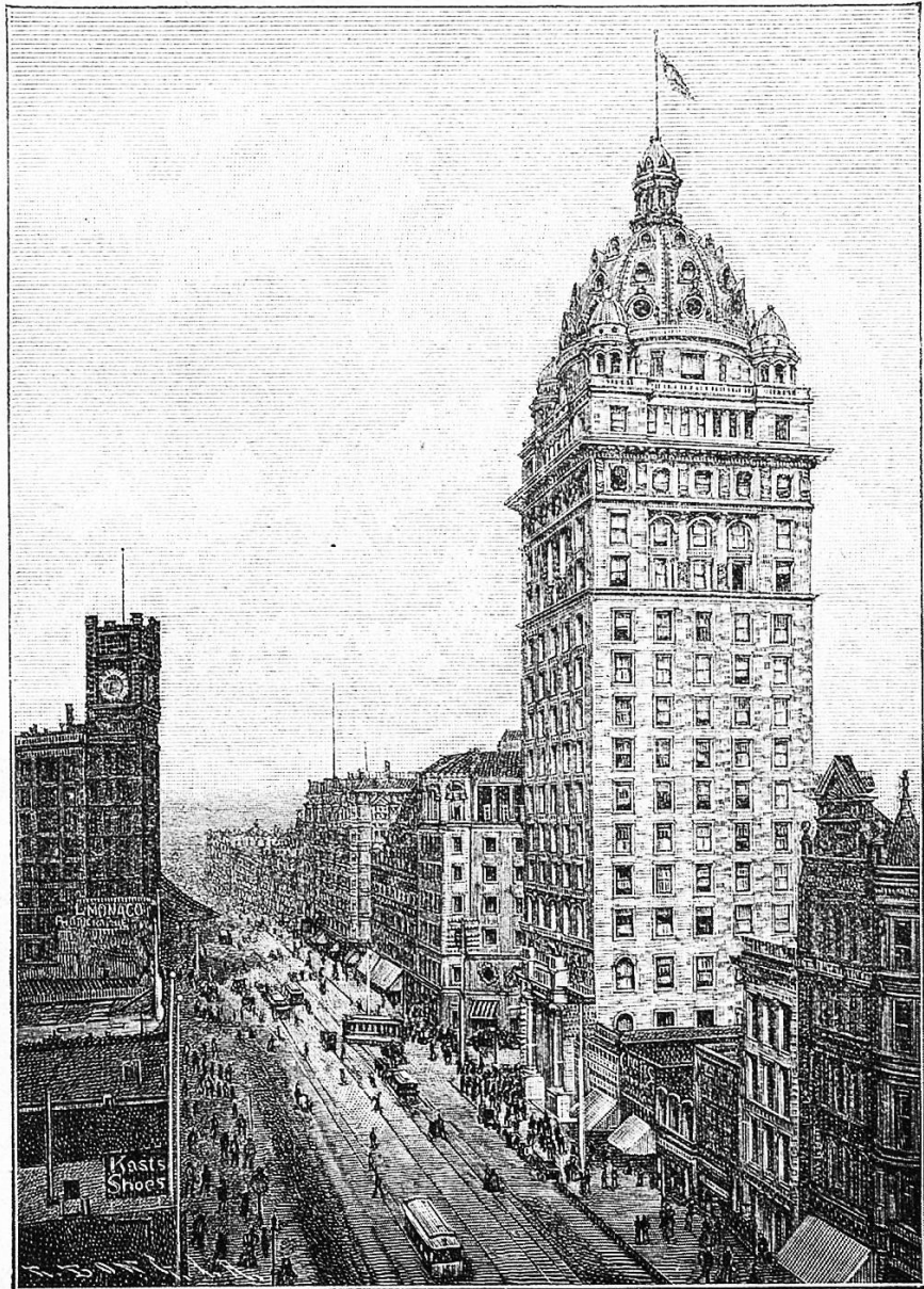
San Francisco: Das Call-Gebäude auf der Market Street.

richtung hin Front machend, durcheinander standen. Das schöne Wetter, da es im Sommer selten oder nie regnet, hatte die Leute dabei ermutigt, jeden nur möglichen Stoff zu benutzen, eben ein Gefach eher als ein Dach zu bekommen, und weniger der Witterung als den Blicken der Nachbarn und Vorübergehenden entzogen zu sein. Häuser — wenn man sie überhaupt so nennen kann — waren aus dem