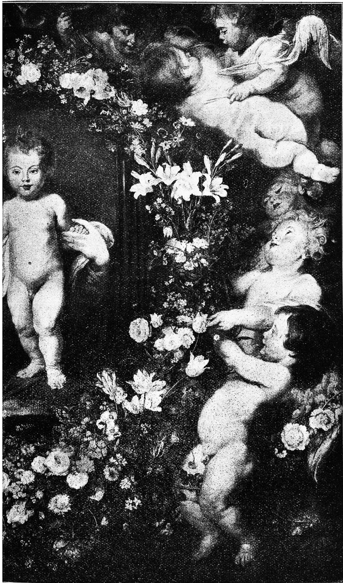
Ein Gemälde von Peter Paul Rubens.