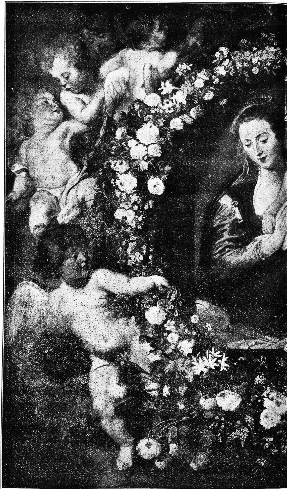
Madonna im Blumenkranz. Nach einer