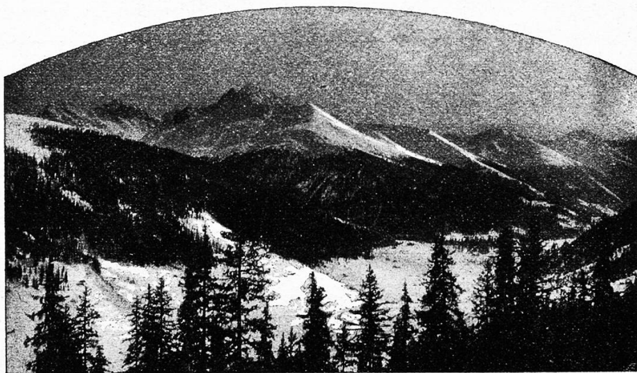
Ausblick von der Schafalp im Winter.

vor jedem Zuviel hüten. Punkt halb Zehn findet sich jeder auf seinem Liegestuhl ein. Da wird gespielt und gelesen. Das schweizerische Nationalspiel, „der Jass“, ist in den meisten Anstalten wegen der damit verbundenen Aufregung verboten.