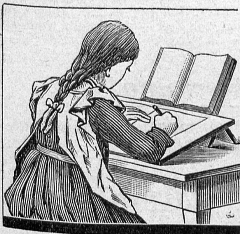
Schreib- und Lernpult

Aufbewahrung und Verwaltung von Wertpapieren , Vermittlung von Kapitalanlagen, Geldwechsel etc.