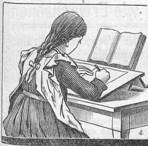
Schreib- und Lernpult

Aufbewahrung und Verwaltung von Wertpapieren, Vermittlung von Kapitalanlagen, Geldwechsel etc.