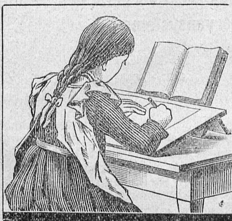
Schreib- und Lernpult

Altbewährte Hustenmittel, noch von keiner Imitation erreicht, überall käuflich.