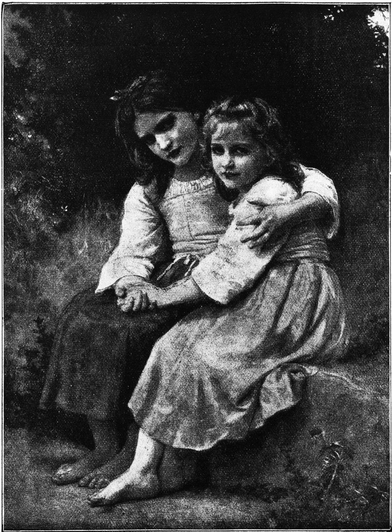
Freundinnen. Nach dem Gemälde von Bouguereau.