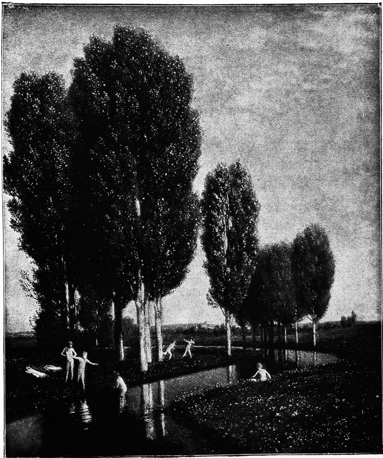
Ein Sommertag. Nach dem Gemälde von Arnold Böcklin.