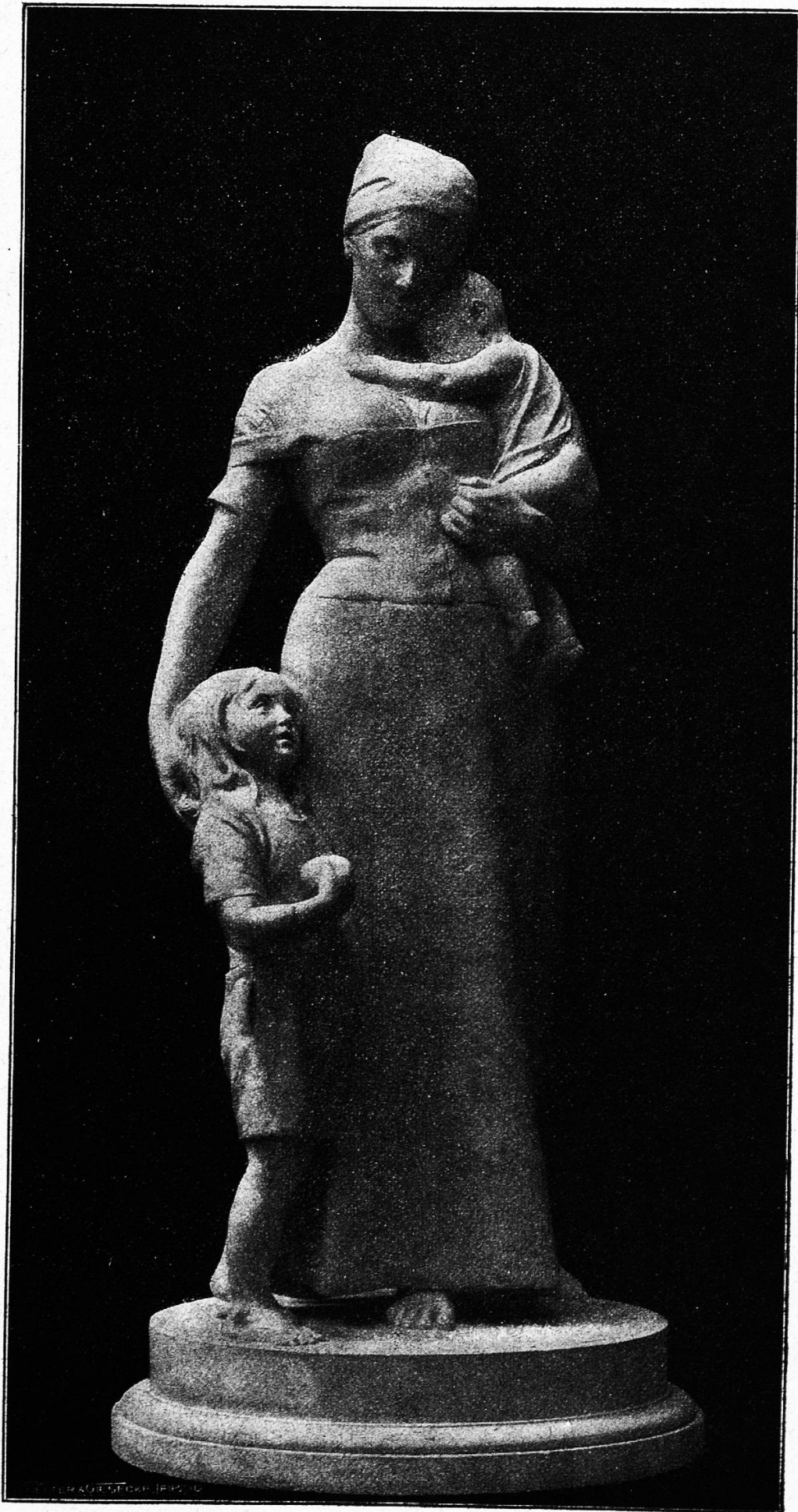
„Der Abend.“ Gruppe von O. Richter.