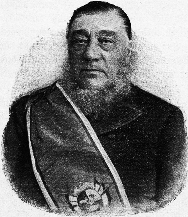
Paul Krüger, Präsident der Südafrikanischen Republik.

Er ist im Jahre 1825 bei Colesberg in der Kapkolonie geboren und machte in Gemeinschaft mit seinen Eltern 1837 den großen Boerentreck mit, der die Boeren nach Natal, Oranje und über den Vaal führte.