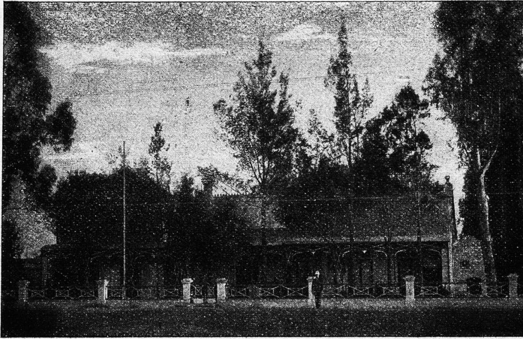
Wohnhaus des Präsidenten Krüger in Pretoria.