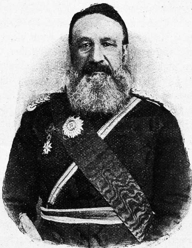
General Joubert, Oberbefehlshaber der Transvaal-Boeren, gestorben im März 1900.

seine Kriegsführung ist, in der er jeden Felsvorsprung, jeden Strauch als Deckung geschickt zu benutzen weiß, das haben die Engländer schon zur Genüge erfahren. Jetzt haben die letztern ihre Uniformen der Erdfarbe angepaßt und sogar die Geschütze mit einem grünlichgrauen Anstrich versehen. Die Abzeichen der Offiziere aber entgehen auch jetzt dem Adlerauge der Boeren nicht, wie die Verlustlisten zeigen. Salvenfeuer zu geben, ist nicht ihre Art. Als treffsicherer Scharfschütze liegt der Boer ruhig im Anschlag und nimmt sein Ziel, in erster Linie den Offizier, auf's Korn. Dabei spart er bedeutend Munition. Was diese anbelangt, so wurde von englischer Seite die Ansicht ausgesprochen, daß bei längerer Dauer des Krieges die Boeren sich bald verschießen würden. Indessen sind die Boeren seit langer Zeit gerüstet gewesen. Man hat die Zahl der Patronen, welche die Deutschen im Krieg von 1870/71 gebraucht haben, etwa 18 Millionen, als Maß angenommen und sich danach eingerichtet, indem man die doppelte Zahl, 36 Millionen anschaffte.