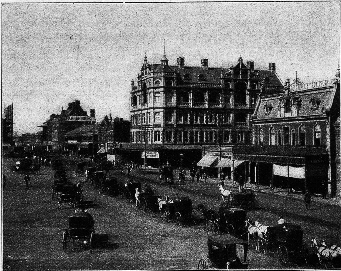
Straße in Johannesburg.