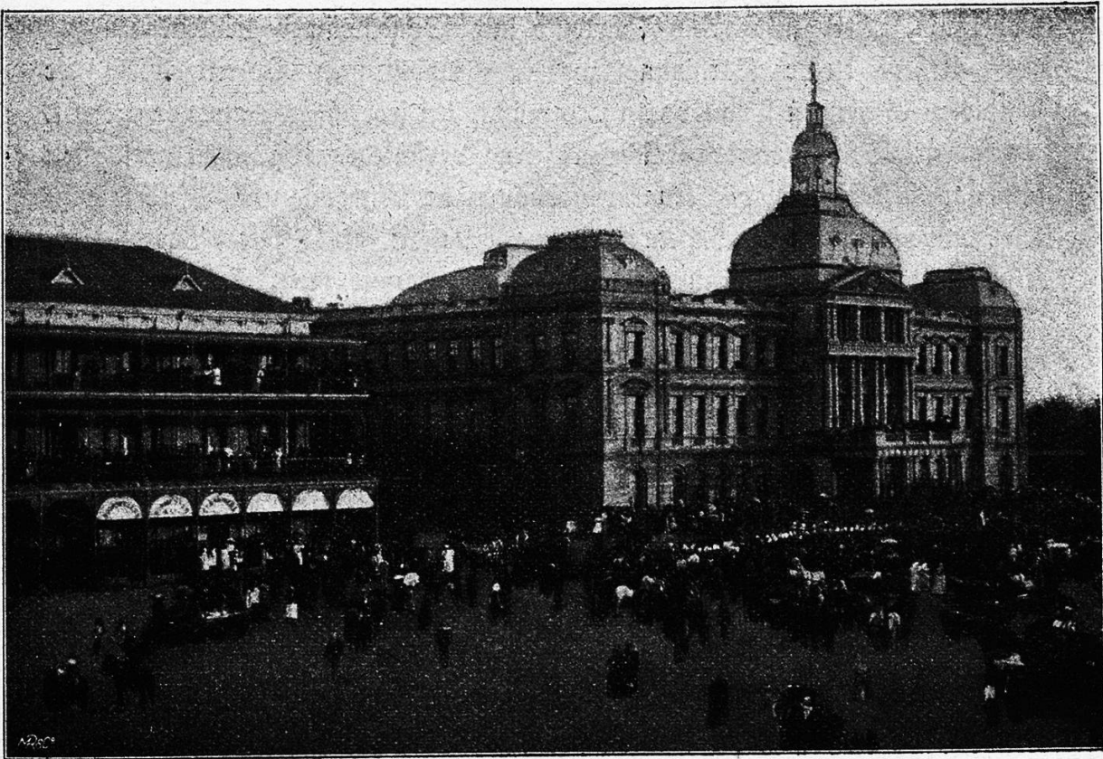
Das „Regierungsgebäude“ in Pretoria.

gleiche Reichtum bewirkte auch die gefährliche Trennung der Boeren und Uitlanders und die Gründung der Republik Transvaal.