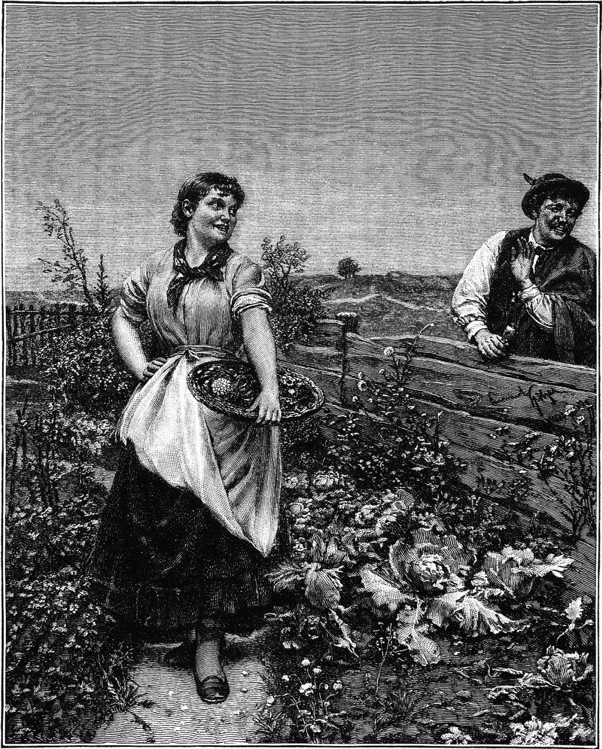
„Abgeblüht.“ Nach einem Gemälde von Emanuel Spitzer.