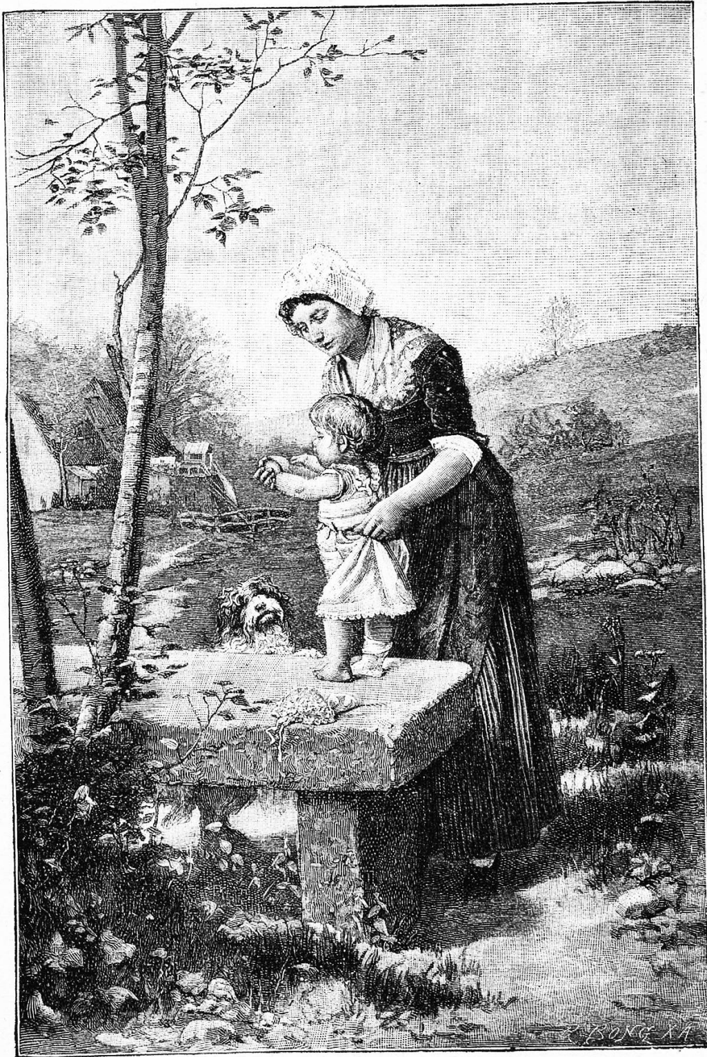
Der erste Schritt. Nach einem Gemälde von Kleinmichel.