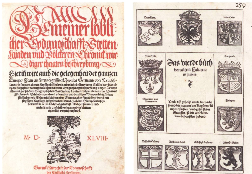
Fig. 01 & 02 : Johannes STUMPF, Gemeiner lobli / cher Eydnoschafft Stetten / Landen und Voelckeren Chronick..., page de titre & fo 259r, Zürcher Stadtbibliothek ( https://www.e-rara.ch/zuz/content/zoom/1525952 ).

Les chapitres IV–XIII de cette « encyclopédie » en 2 volumes in-folio imprimés en 1548 concernant la Suisse sont illustrés d'environ 1649 armoiries d'un trait parfait mais sans indications de couleurs. « Les armoiries se composent de deux éléments : des figures et des couleurs. S'il existe quelques cas d'armoiries qui sont dépourvues de figures (...), il n'en existe pas qui soient dépourvues de couleurs. C'est l'élément essentiel du blason » 1 . La quasi-totalité des armoriaux figurés du Moyen Âge qui nous sont parvenus sont en couleurs 2 . L'apparition de l'imprimerie ne permettant plus une large utilisation de la couleur verra la création de différents systèmes conventionnels pour représenter les émaux, dont les hachures utilisées par Silvestre de Pietra Santa en 1638 qui ne